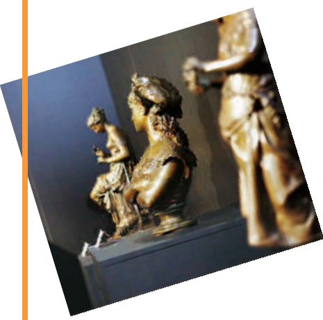
西方雕塑工艺精品也出现在展厅内。