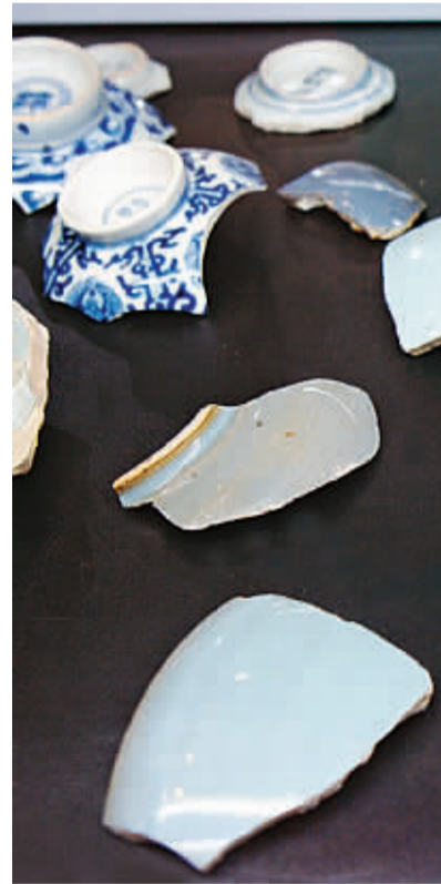
参展商家展示的瓷片。