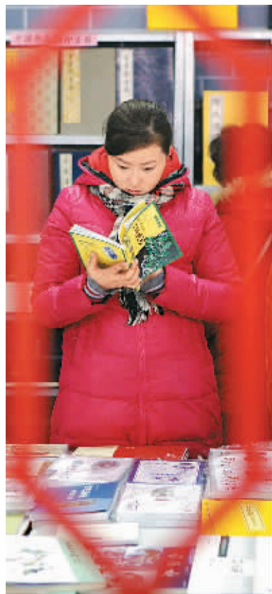
文物鉴赏图书在现场热卖。