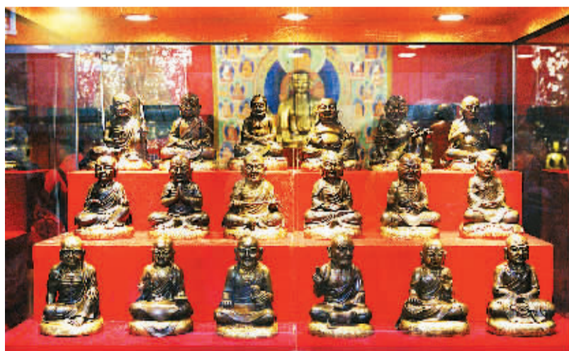
十八世纪铸造的合金铜罗汉。