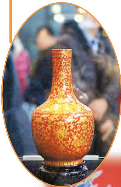
清道光年间的「珊瑚红描金宝相花寿字纹瓶」。