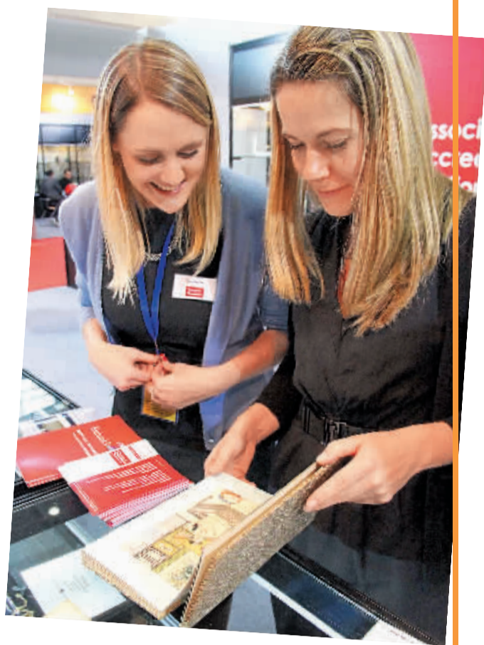
外国观众正在欣赏古籍藏品。黄小兵

国运盛，收藏兴。文物艺术品交易产业是经济社会发展的寒暑表。目前，北京不仅是内地文物艺术品交易的中心，而且正逐渐成为继英国伦敦、美国纽约、中国香港之后的世界第四大中国文物艺术品交易中心。