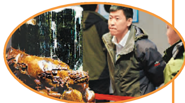
人们驻足观赏“碧玉王”。