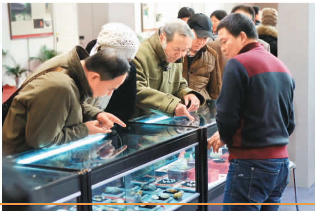
文博会参观人数超过三万人次，交易额突破两千万。