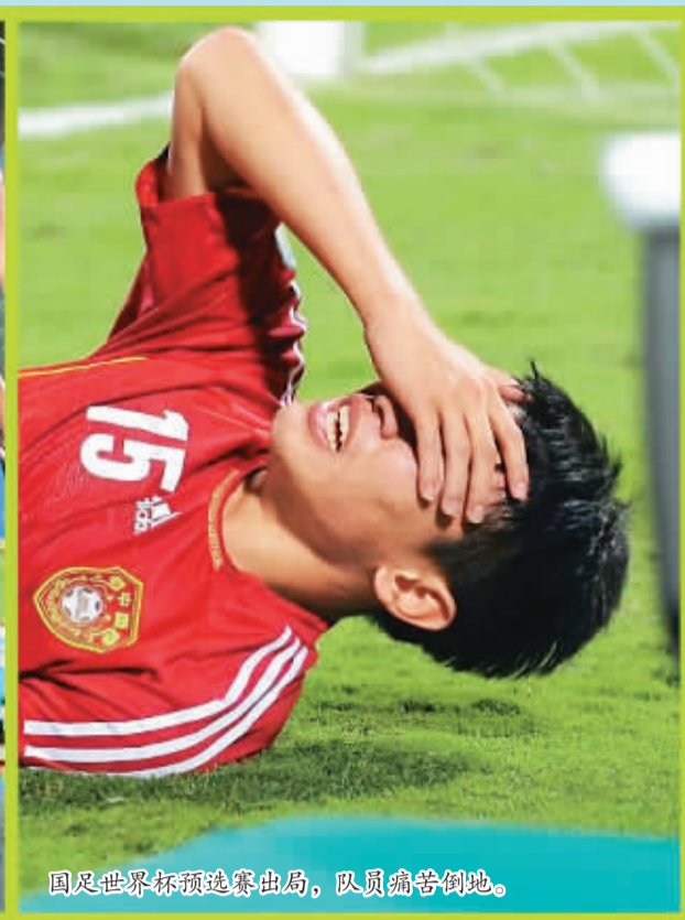
国足世界杯预选赛出局，队员痛苦倒地。