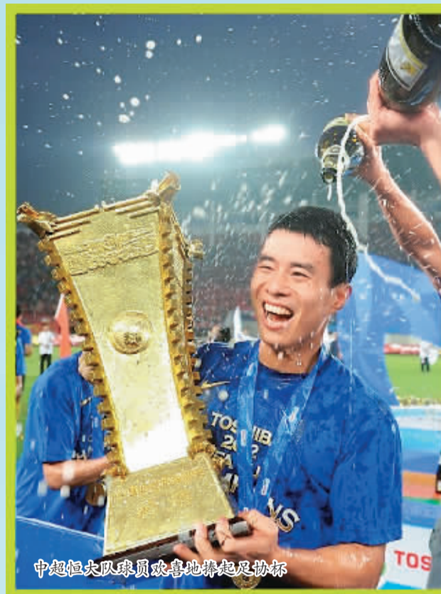
中超恒大球员欢喜地捧起足协杯