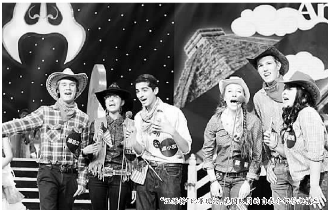
“汉语桥”比赛现场，美国队员的自我介绍妙趣横生

“我爱汉语桥！”11月25日的闭幕式结束后，参加“汉语桥”比赛的选手们聚在舞台上，全力喊出了自己的心声。他们相互拥抱，许多选手流下了动情的泪水。