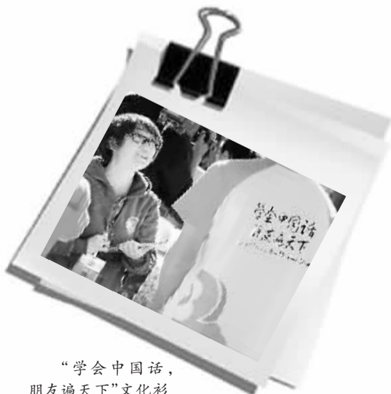
“学会中国话，朋友遍天下”文化衫

该项目要把蓝月山谷打造成国际化高原旅游名镇，前期投资15亿元人民币。云南希望通过项目发展招商，吸引国际、国内500强企业及社会资本、艺术家和人才进驻该地。