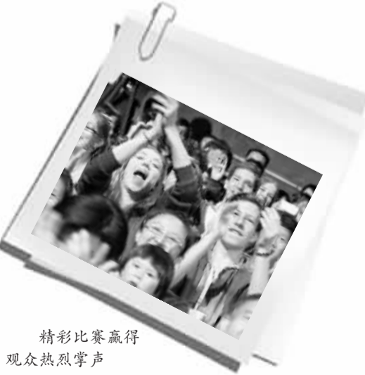
精彩比赛赢得观众热烈掌声

“汉语桥”比赛是一场比赛，也是全世界汉语学习者的聚会，选手们在这里检验、交流汉语学习的成果，圆了自己的“中国梦”。从考试选手对中国了解程度的笔试，到精彩纷呈的才艺展示，各国选手们都使出了十八般功夫。来自蒙古