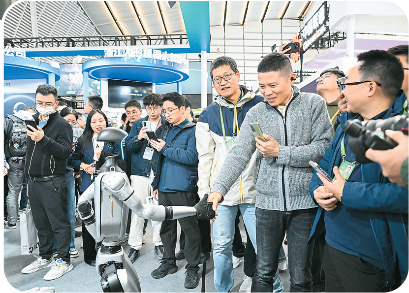
在2024年世界互联网大会“互联网之光”博览会人形机器人专区，参观者与一款人形机器人握手。

不仅如此，包括AI智能体、虚拟数字人等智能应用纷纷“跳出展台”，为本次峰会提供保障和服务。对此，网友“芒果小洋”评论称：“一个‘智’字，可以说贯穿整个乌镇