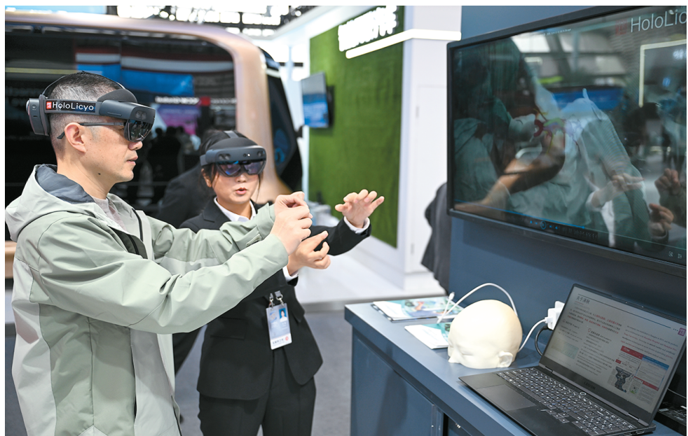
在2024年世界互联网大会“互联网之光”博览会上，参观者体验一款全息智能医学影像系统做手术的过程。

一桥架梁，关山不远。一个联系紧密的全球网络空间“朋友圈”日益活跃起来。网友表示，通过搭建平台，乌镇峰会正不断扩展着与世界的“对话”，相信在迈入第二个十年后，世界互联网大会将继续探寻携手构建网络空间命运共同体的时代答案。