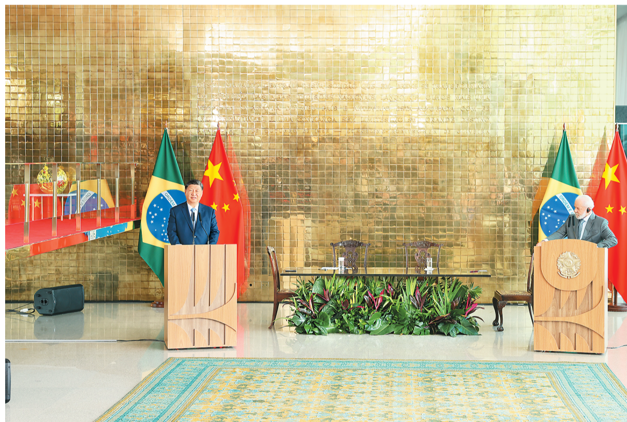
当地时间11月20日上午, 国家主席习近平同巴西总统卢拉在巴西利亚总统官邸黎明宫会谈后共同会见记者。