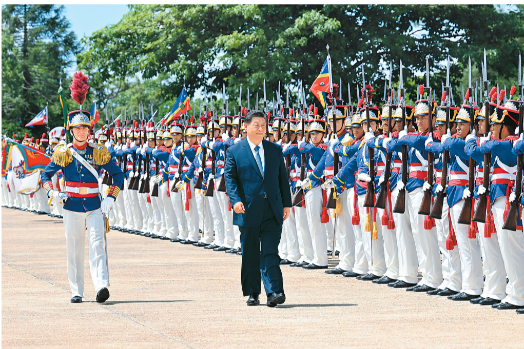
当地时间11月20日上午, 国家主席习近平在巴西利亚总统官邸黎明宫同巴西总统卢拉举行会谈。会谈前, 卢拉总统和夫人罗塞拉热情迎接习近平, 并为习近平举行隆重盛大欢迎仪式。