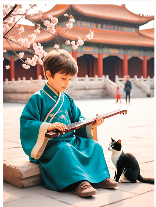
琴韵春风 梦回古都