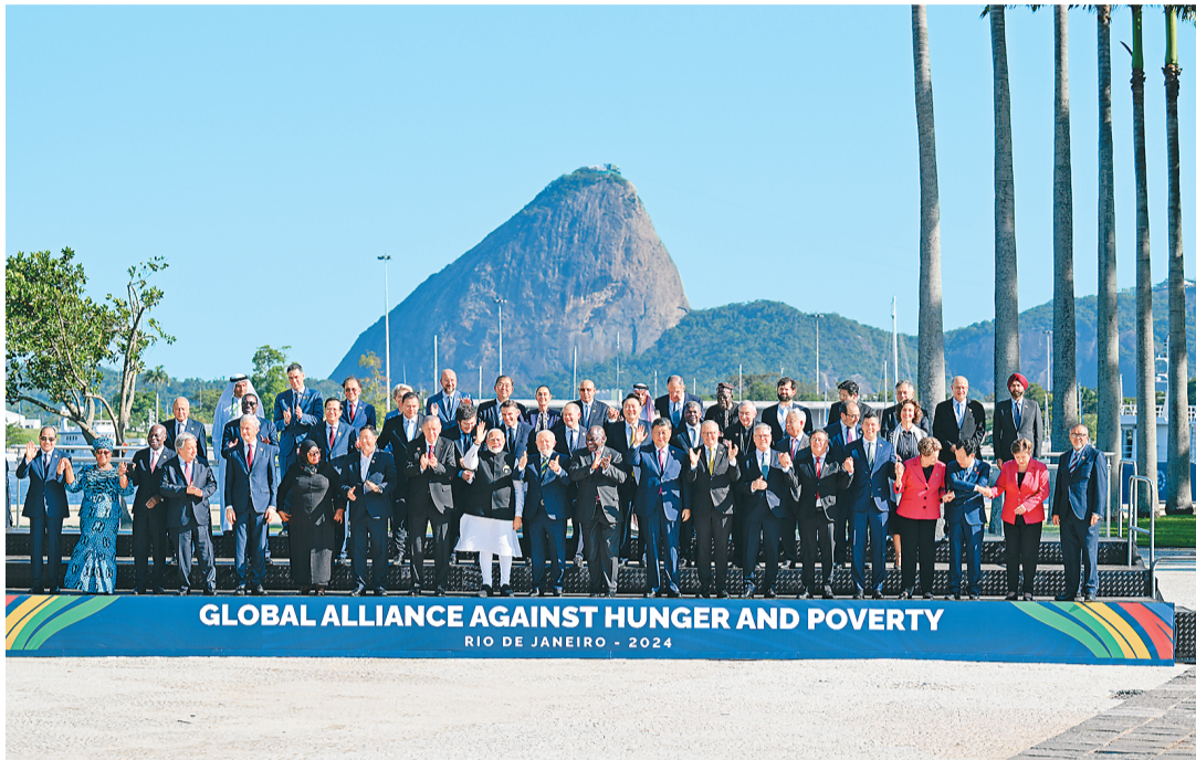
当地时间11月18日上午,国家主席习近平在巴西里约热内卢出席二十国集团领导人第十九次峰会。峰会把“构建公正的世界和可持续的星球”作为主题,并决定成立“抗击饥饿与贫困全球联盟”。这是习近平同与会领导人共同参加巴方发起的“抗击饥饿与贫困全球联盟”合影。