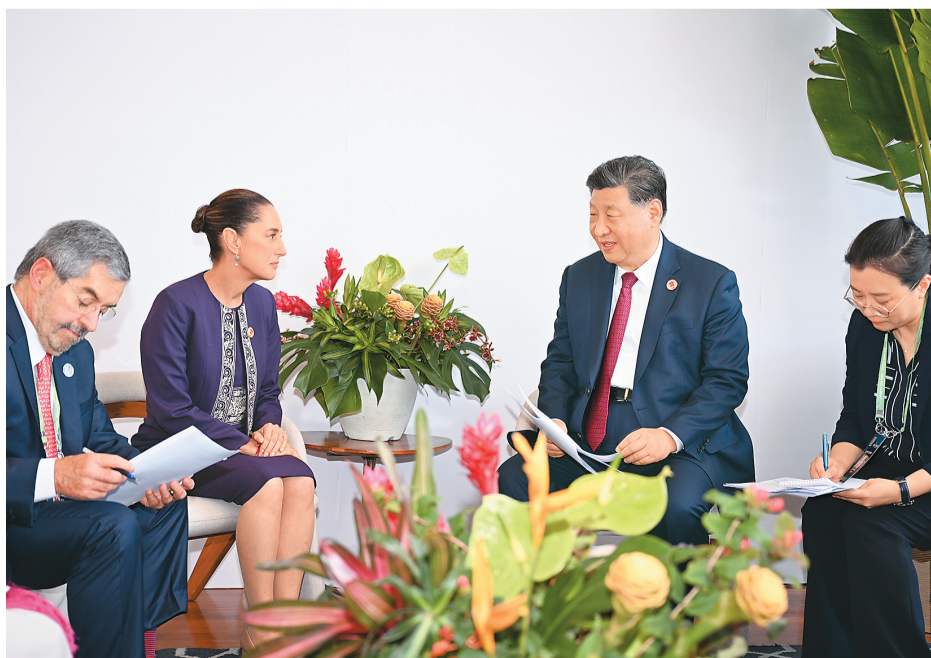
当地时间11月18日下午,国家主席习近平在里约热内卢出席二十国集团领导人峰会期间会见墨西哥总统辛鲍姆。

辛鲍姆表示,很高兴结识习近平主席,我完全赞同您对我们两国关系的评价。中墨两国虽然相距遥远,但联系十分密切。很多中国企业在墨西哥开展业务,包括参与墨西哥重要基础设施项目建设。感谢中方在墨西哥遭遇飓风等困难时刻给予大力真诚帮