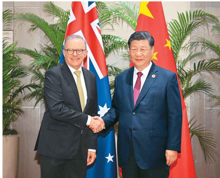
当地时间11月18日上午, 国家主席习近平在里约热内卢出席二十国集团领导人峰会期间会见澳大利亚总理阿尔巴尼斯。

本报里约热内卢11月18日电 (记者刘少华、陈海琪) 当地时间11月18日上午, 国家主席习近平在里约热内卢出席二十国集团领导人峰会期间会见澳大利亚总理阿尔巴尼斯。 习近平指出, 去年11月, 我们在北京就事关中澳关系长远发展的战略性、全局性、方向性问题进行了深入沟通。一年多来, 两国各层级保持密切沟通交往, 积极推进落实我们达成的重要共识, 取得积极进展。中澳之间没有根本利益