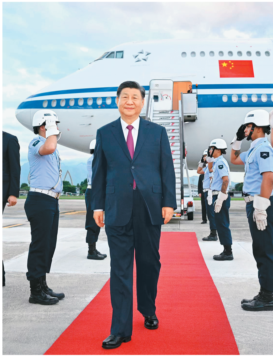
当地时间11月17日下午, 国家主席习近平乘专机抵达里约热内卢, 应巴西联邦共和国总统卢拉邀请, 出席二十国集团领导人第十九次峰会并对巴西进行国事访问。