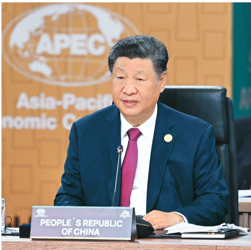
当地时间十一月十六日上午，亚太经合组织第三十一次领导人非正式会议在秘鲁利马会议中心举行。国家主席习近平出席并发表题为《共担时代责任 共促亚太发展》的重要讲话。