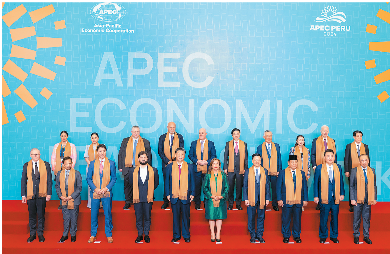
当地时间十一月十六日上午，亚太经合组织第三十一次领导人非正式会议在秘鲁利马会议中心举行。国家主席习近平出席并发表题为《共担时代责任 共促亚太发展》的重要讲话。这是习近平同其他亚太经合组织成员经济体领导人、代表合影。

几十年来，亚太经合组织带动亚太地区实现大发展、大繁荣、大融通，助推亚太成为全球最具活力板块和主要增长引擎。当前，世界百年变局加速演进，亚太合作也面临地缘政治、单边主义和保护主义上升等挑战。站在历史的十字路口，亚太各国要团结协作，勇于担当，推动构建亚太命运共同体，努力开创亚太发展新时代。