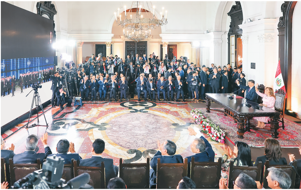
当地时间11月14日晚,国家主席习近平同秘鲁总统博鲁阿尔特在利马总统府以视频方式共同出席钱凯港开港仪式。