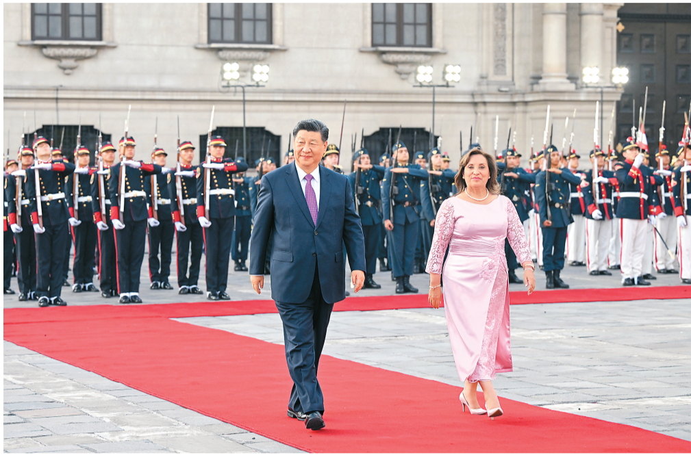
当地时间11月14日下午,国家主席习近平在利马总统府同秘鲁总统博鲁阿尔特举行会谈。博鲁阿尔特在总统府前广场为习近平举行隆重盛大欢迎仪式。