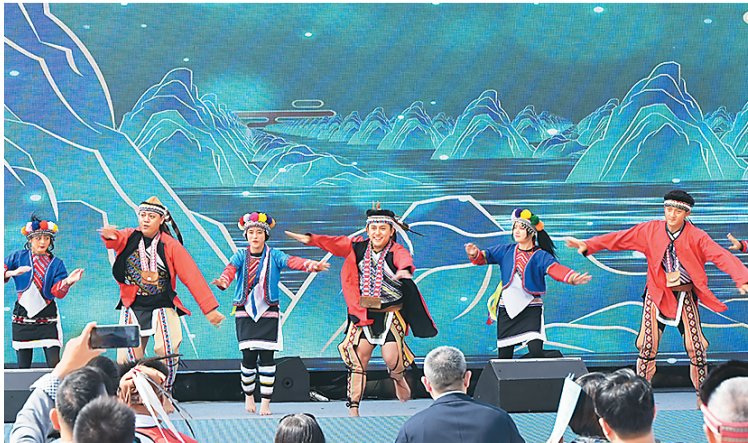
图为活动开幕式的表演。

温州市台办相关负责人表示，今年以来，温州市在台商投资、台青就业和鼓励两岸民间交流等方面，推出了一系列政策措施，包括雁荡山面向台胞的免门票政策，为广大台胞来温创业就业、学习交流提供很好的便利和服务。希望更多台湾同胞特别是广大台青朋友，经常到大陆、到浙江、到温州走一走看一看，增进了解、厚植友谊，寻找机会、携手发展，共创美好未来。