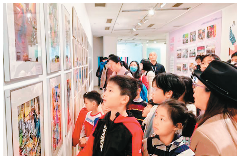
第十五届海峡两岸少儿美术大展吸引不少小朋友前来观展。

以“一起”为主题的第十五届海峡两岸少儿美术大展11月3日在北京今日美术馆开幕，共240组青少年美术作品参展，打造了以艺术