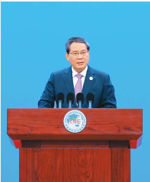
11月5日，国务院总理李强在上海出席第七届中国国际进口博览会暨虹桥国际经济论坛开幕式，并发表主旨演讲。

本报上海11月5日电（记者田泓、罗珊珊、龚鸣）11月5日，国务院总理李强在上海出席第七届中国国际进口博览会暨虹桥国际经济论坛开幕式，并发表主旨演讲。李强表示，举办进博会是中国扩大开放合作的重要举措，是我们面向世界作出的郑重承诺。从2018年至今，进博会年年举办，从未间断。如果说首届进博会是中国向世界发出的单向邀约，之后的每一届便是中国和世界双向奔赴的共同约定，反映了大家对开放合作的共同心愿。当今世界，百年变局加速演进，逆全球化思潮抬头，