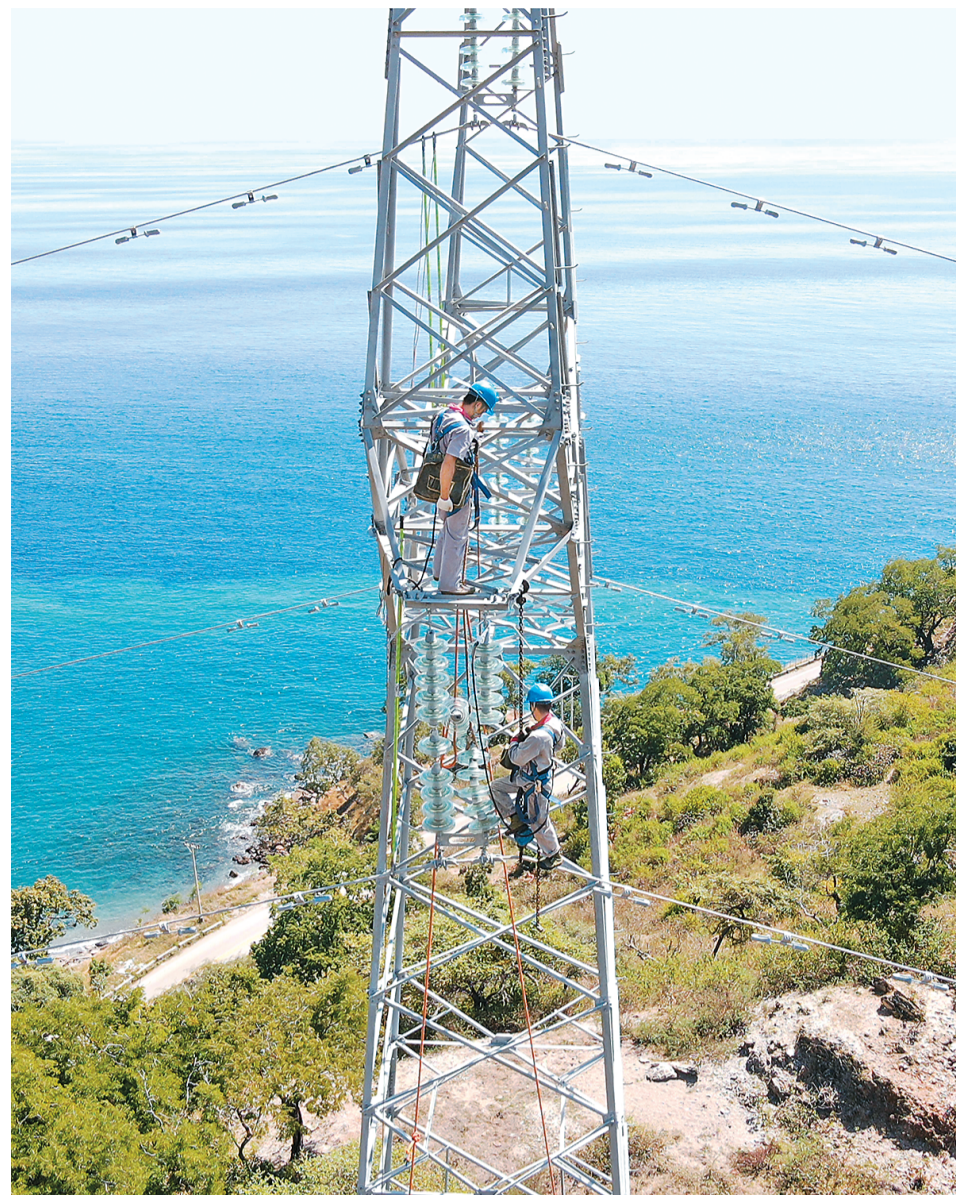
▲在中核集团东帝汶国家电网运行与维护项目，巡检工人正在进行铁塔线路检修与维护。

10多年来，共建“一带一路”合作从亚欧大陆延伸到非洲和拉美。越来越多的中国建设者走向海外、坚守海外，修筑各类基础设施项目，在海外建设一线挥洒汗水。在服务海外项目过程中，中国建设者注重保护环境、融入当地，书写了绿色发展、守望相助的故事。