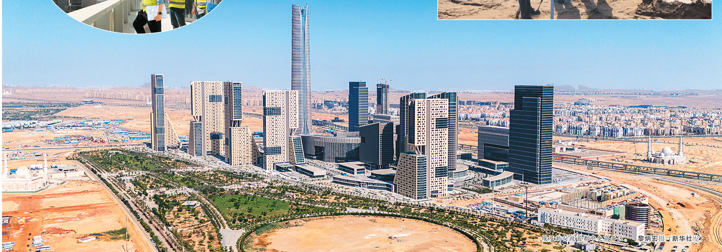
埃及新行政首都中央商务区。