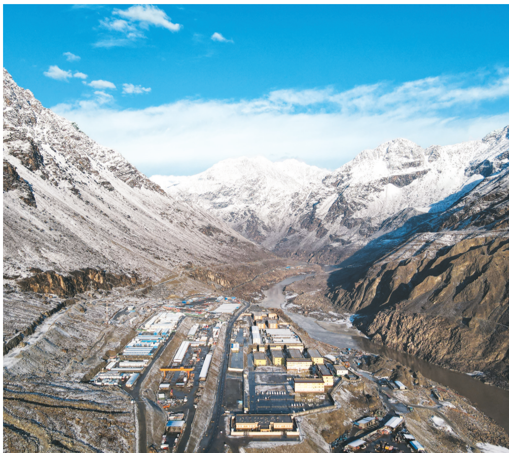
▲中国电建承建的巴基斯坦巴沙大坝是世界上在建最高、规模最大的碾压混凝土大坝，建成后每年将为巴基斯坦提供180亿千瓦时的清洁电力。