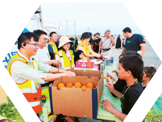
▲中国电建承建伊拉克示范学校项目开展“情满中伊，爱满人间”公益活动——为当地群众免费发放食品、水果和饮用水。