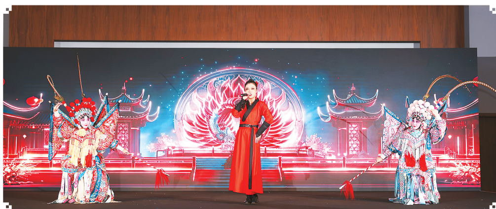
中国演员在活动现场表演节目《刀马旦》。