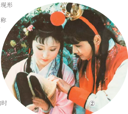
图①：《大闹天宫》剧照。 图②：《红楼梦》剧照。 图③：《亮剑》海报。 图④：《繁花》剧照。 图⑤：《河西走廊》海报。