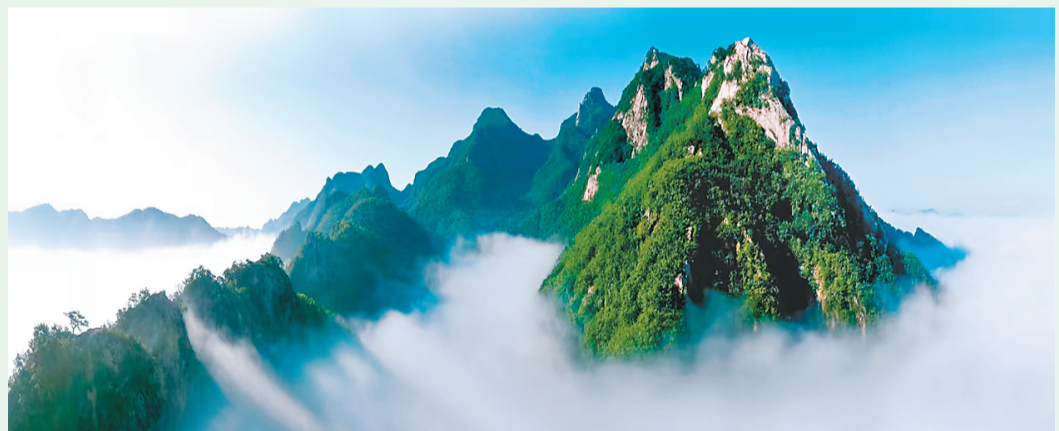
▲辽宁凤凰山国家级风景名胜区

线路是水上丹霞地质遗迹和历史文化双遗产地，是闽北重要的自然文化体验地、观光休闲目的地，也是红色文化传承地和集体林权制度改革改革的典型示范地。 七、湖南世界奇观生态旅游线路 线路依托张吉怀高铁、黔张常铁路、张花高速、包茂高速等交通干线，串联起大湘西地区世界自然文化遗产、自然保护区等世界级生态旅游精品资源，是以森林旅游、山水观光、民族文化体验、世界遗产浏览为主要特色的生态旅游线路。 八、广东绿游广府—探秘森林城市群里的世外桃源生态旅游线路 线路充分展示了现代都市圈建设、生态保护和广府文化传承协同发展的成果，既有高楼林立的城市，也有神秘的自然保护地，还有飞鸿故里和舞龙舞狮，人与自然和谐共生，是广佛都市圈居民休闲康养、科普教育、户外运动的理想之地。 九、四川大熊猫寻踪生态旅游线路 线路以大熊猫自然栖息地探秘为主题，历史文化悠久，藏羌民族风情独具特色，是风景最亮丽、科普教育内容最丰富的全球大熊猫寻踪精品线路，可深刻感受国家公园建设保护成效，体验大熊猫文化魅力和生物多样性。 十、贵州世界自然遗产地风光生态旅游线路 线路既是喀斯特和丹霞地貌典型的世界自然遗产地，也是生态系统和生物多样性类型的世界自然遗产分布地，具有典型的西南喀斯特山水景观、山地森林景观和生物多样性以及浓郁的民族文化和红色文化，既可感受奇山秀水的神奇魅力，也可重温伟大不屈的长征精神，还能在民族村寨中体验“村超”“村BA”。 十一、西藏国道318生态旅游线路 线路拥有世界著名的高山、湖泊、草原和季相植物景观，森林和草原生态系统垂直海拔分布明显，是藏牦牛、藏羚羊、藏野驴、黑颈鹤等重要野生动物的栖息地，也是远观冰川活动的绝佳之地，充分展示了青藏高原典型自然景观、生态系统和地质遗迹。 十二、陕西中华祖脉·大美秦岭生态旅游线路 线路集中展现秦岭卓绝的自然生态之美和其所孕育的源远流长、博大精深的中华文明，让人们在享受自然之美，探寻中华文明起源、发展脉络和灿烂成就的过程中汲取精神滋养和前进力量。 十三、新疆阿勒泰千里画廊生态旅游线路 线路是中国唯一的欧洲—西伯利亚泰加林生态系统分布区，是哈纳斯国家级自然保护区和可可托海世界地质公园所在地，也是中国北方最重要的自然观光和冬季滑雪目的地之一。 十四、大兴安岭神州·北极遇见53°生态旅游线路 线路位于中国地理位置最北的区域，具有寒温带森林生态系统的典型性和原真性，是寒温带湿地生态系统和生物多样性的主要分布地，也是中俄边境黑龙江沿岸自然风光的典型代表，还是以抗联精神为代表的红色文化的传承地和北方大兴安岭地区民族文化和冰雪文化的展示窗口。