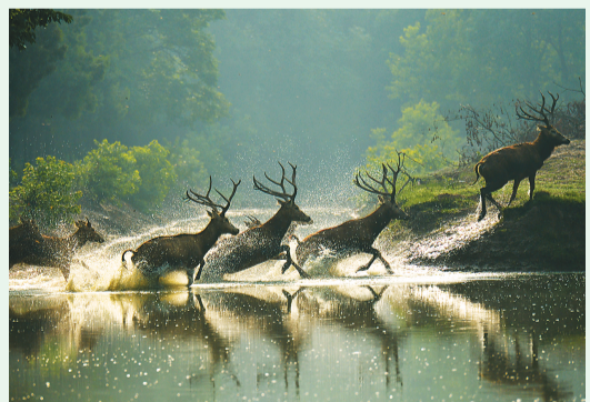
▲江苏大丰麋鹿国家级自然保护区 杨国美摄 ▲中国黄（渤）海候鸟栖息地 ▼新疆维吾尔自治区白哈巴国家森林公园