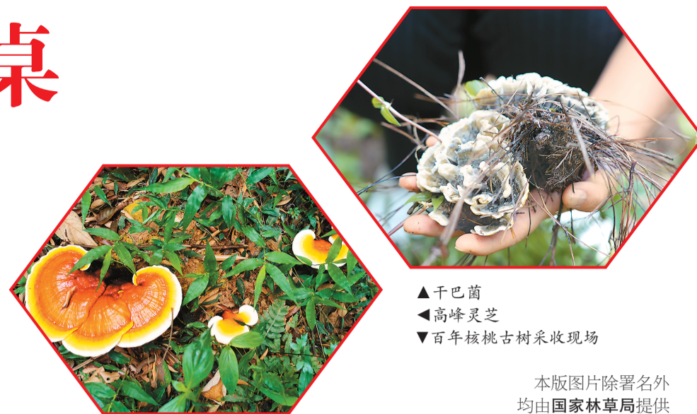
▲干巴菌 ▲高峰灵芝 ▼百年核桃古树采收现场