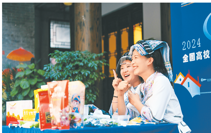
2024年全国高校乡村振兴网络技能大赛决赛日前在贵州省黔东南布依族苗族自治州兴义市举行。图为参赛选手在兴义市大佛场直播带货。

“时间都去哪了？”时间利用调查可以回答这一问题。10月31日，国家统计局发布第三次全国时间利用调查公报。该调查通过了解居民在各项活动上的时间投入，提供了观测居民日常生活、评估民生福祉改善、了解经济社会发展的新维度。