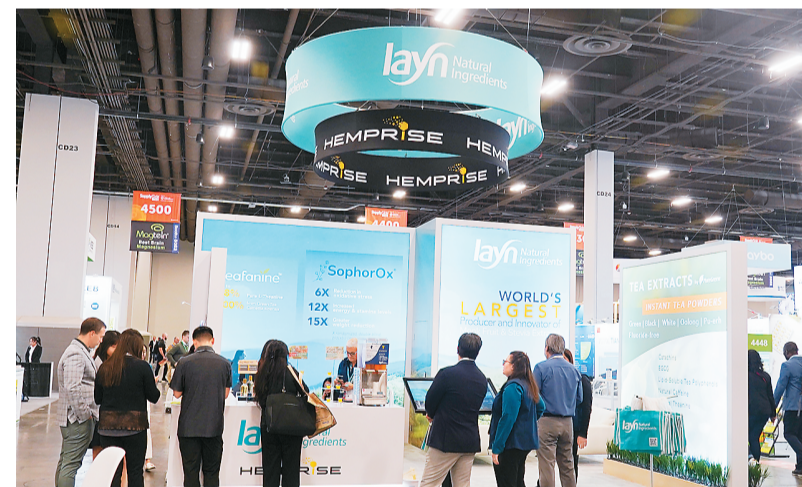
10月30日，2024年中国创新健康原料品展在美国拉斯维加斯开幕，近百家中国企业参展，展示了中国独具传统优势的健康产品原料、创新原料及研发、生产等领域的创新技术。图为参观者在中国企业展台洽谈交流。

态。在南海某海域，辽宁舰、山东舰编队首次开展双航母编队演练，锤炼提升航母编队体系作战能力。 这次任务横跨中秋、国庆等节日，编队官兵坚守岗位、连续奋战，把对家人的思念和对祖国的祝福，转化为一线练兵、能战胜战的昂扬斗志，在远海大洋为祖国和人民护航。