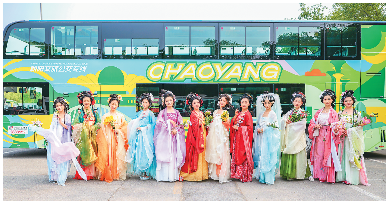
游客身穿汉服体验文旅公交专线游览。

《实施意见》提出，到2029年，旅游产业增加值占全市GDP比重超过5%，旅游总人数年均增长2%以上，旅游总收入年均增长4%左右，入境游人数年均增长5%左右，国家5A级旅游景区、各类国家级旅游特色业态