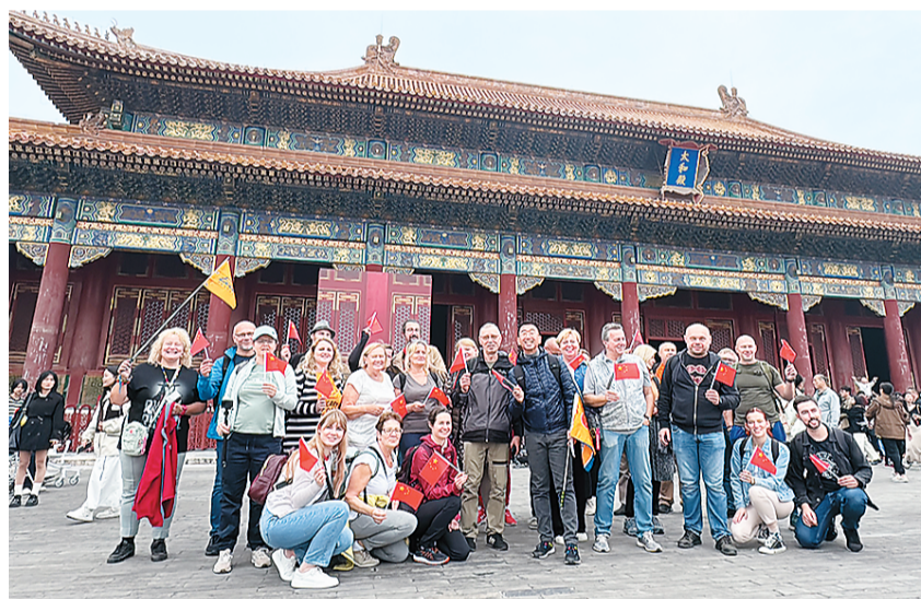
波兰游客参观游览北京故宫。