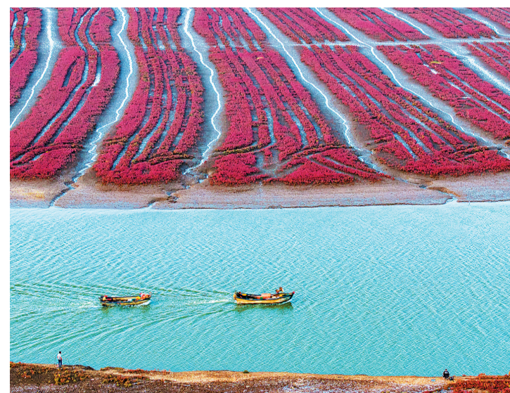
青岛西海岸新区的红海滩风光。

位于山东青岛西海岸新区红石崖街道的红海滩，犹如大自然在金秋泼洒的一幅精美画卷，淋漓尽致地展示出原生态的瑰丽风光。