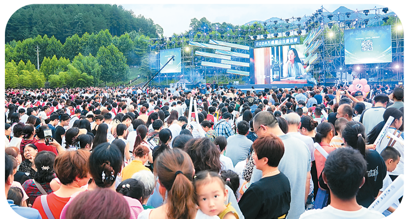
2024万盛黑山谷音乐季吸引了众多游客。

为打造具有烟火气的音乐季，营造年轻潮流的消费场景，重庆市万盛经济技术开发区文化和旅游局依托音乐季陆续开展了广场舞展演、露营节、星空音乐会等10余项文旅活动，推出门票减免、住宿折扣等20余项优惠举措，邀广大游客踏上一场动静结合、精彩纷呈的休闲之旅。