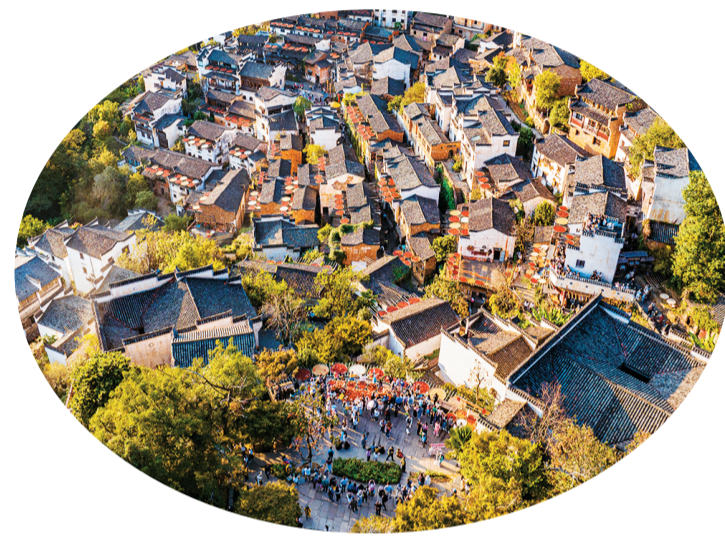
江西婺源篁岭秋色如画。