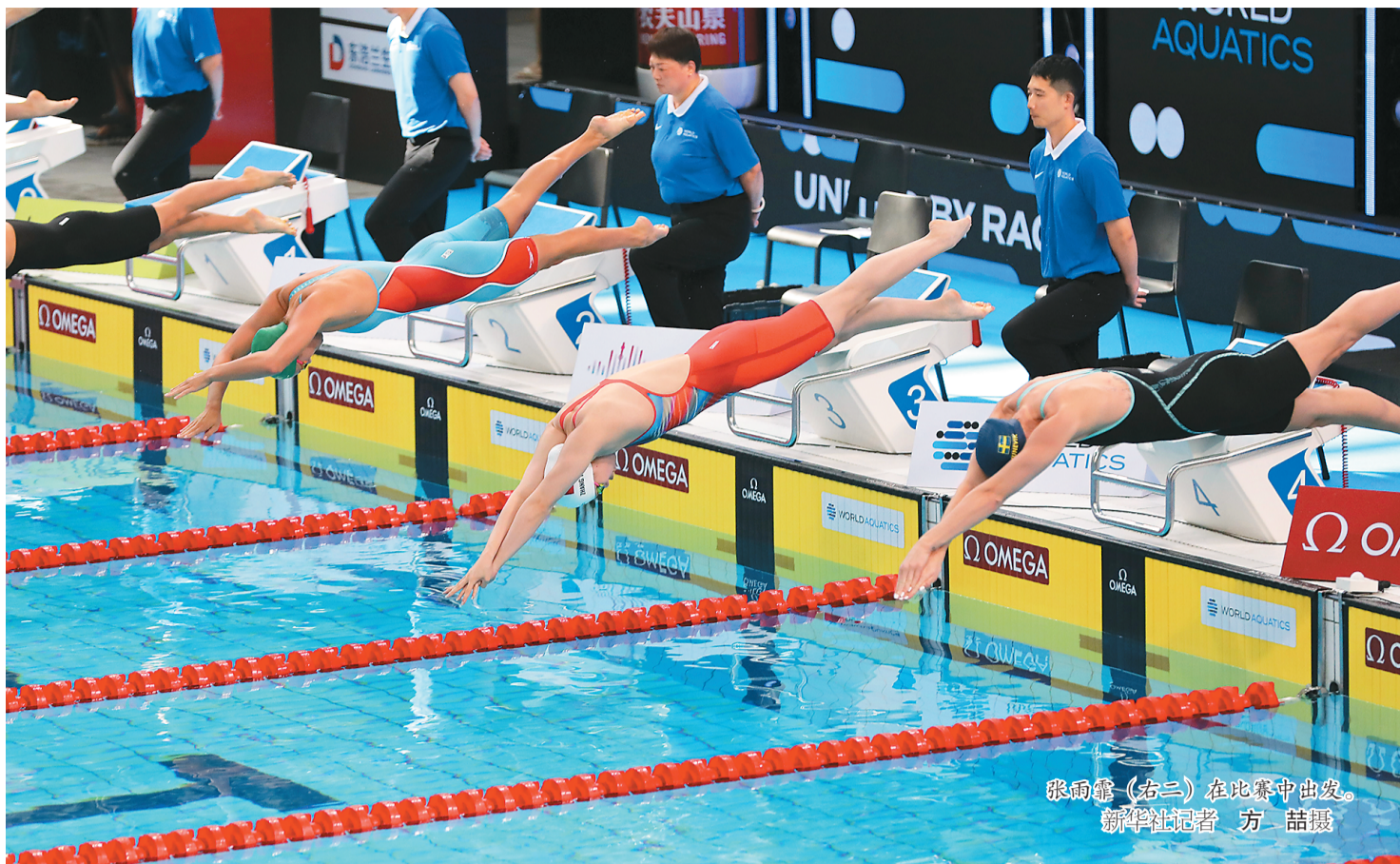
张雨霏(右二)在比赛中出发。

巴黎奥运会上，中国游泳在多个项目取得突破。经过短暂的休整之后，游泳队众将士整装待发，迎接新的挑战。作为洛杉矶奥运会周期的首项国际赛事，中国“泳军”以好状态和高起点，乘风破浪开启新征程。