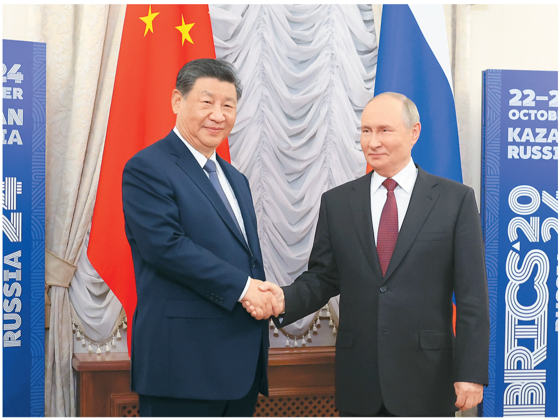
当地时间十月二十二日下午, 国家主席习近平在喀山克里姆林宫同俄罗斯总统普京举行会晤。

本报俄罗斯喀山10月22日电 (记者于宏建、胡泽曦) 当地时间10月22日下午, 国家主席习近平在喀山克里姆林宫同俄罗斯总统普京举行会晤。