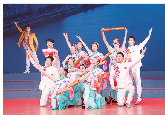
客家古文《展翅新长征》。

10月14日晚，“新长征 再出发”纪念中央红军长征出发90周年主题晚会在于都县文化艺术中心举办，刘兰芳、巩汉林、金珠、刘全和、刘全利等多位深受观众喜爱的曲艺家登台献艺。晚会分为“长征路”“再出发”两个篇章，汇聚了评书《四渡赤水》、陕北说书《胜利会师》、群口快板《集结出发》、峰鼓《一条棉被》、小品《幸福岁月》、鼓曲新唱《新长征 再出发》、客家古文《展翅新长征》等形式多样的节目，不仅再现了红军长征的壮丽篇章，还展现了全国人民在中国共产党的领导下，弘扬伟大长征精神，奋力走好新长征路的精神风貌。