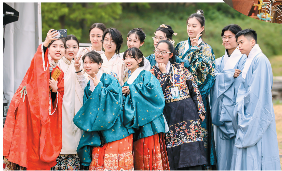
第五届“中国华服日”北京主会场活动在圆明园遗址公园举办。