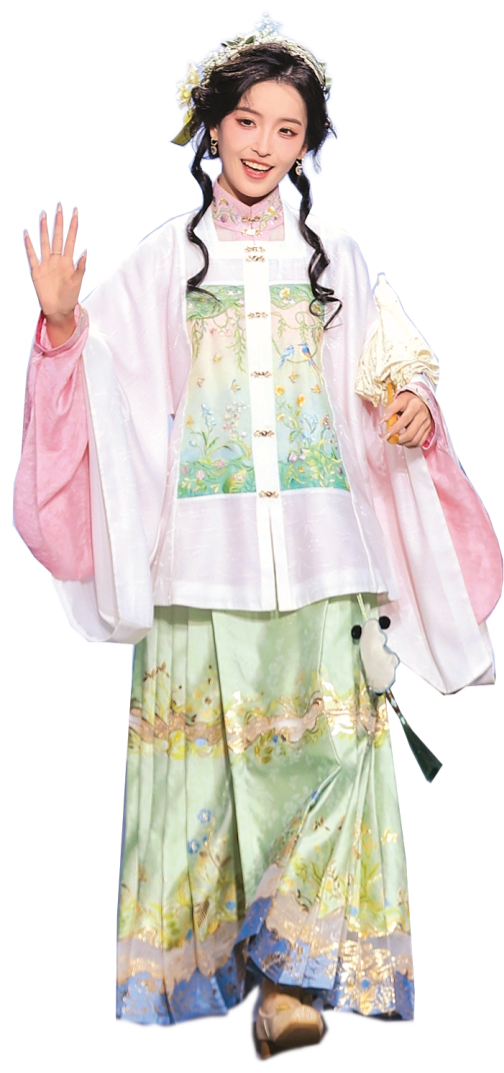
夜走秀。二〇二四“国丝汉服节”汉服之夜。

“中国传统服饰历史悠久、传承有序、自成体系，蕴含了深厚的文化内涵、美学精神和民族特质，如天人合