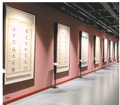
“金石华岳——陈介祺特展”现场。

潍坊自古就是金石重镇，从宋代的赵明诚、李清照，到清代的李文藻、段松苓、刘喜海、陈介祺，金石收藏与研究绵延数百年。展览分为“赓续相承”“富藏精鉴”“翰墨流韵”“宗仰海内”“泽被桑梓”5个部分，展出精品文物400余件，涵盖陈介祺旧藏青铜器、玺印封泥、陶文瓦量、石刻造像及其信札、书法作品，体现陈介祺对家乡金石学的影响与贡献。