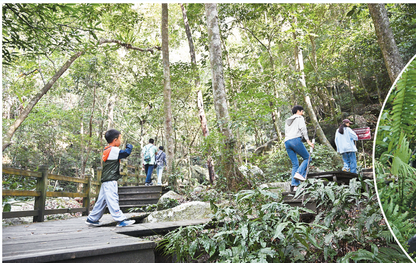
▲游客在海南热带雨林国家公园五指山片区游玩。

国家公园和国家植物园体系建设，是推进生态文明体制改革的重大实践，也是中国实施生物多样性保护战略的重要抓手。10月12日是首批国家公园正式设立三周年，国家林草局日前召开的国家公园和国家植物园体系建设成效新闻发布会介绍，首批国家公园和国家植物园设立以来，保护格局、保护水平、保护能力等方面进展明显，成效显著。