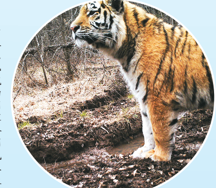
在东北虎豹国家公园龙江森工绥芬河片区拍摄的野生东北虎。新华社发

▲全球首只野外引种成功的大熊猫“草草”（右）及其幼仔“华姝”在野化培训环境中活动。新华社发