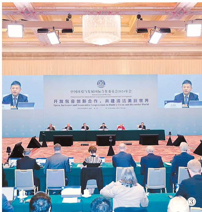
图①：近年来，内蒙古自治区鄂尔多斯市在保证煤炭生产供应的同时，推动能源产业绿色发展，构建起煤化工、新能源装备制造等在内的多元化产业格局。图为鄂尔多斯市伊金霍洛旗一景。 图②：在青海省海西蒙古族藏族自治州德令哈市光伏（光热）产业园拍摄的光热电站。 图③：国合会2024年年会开幕式现场。

“煤炭三角区是中国重要的能源生产和外送基地，69%的煤炭都是调出到外省的，发电量的35%输送到外省。煤炭三角区为国家能源安全作出了巨大的贡献，在实现‘双碳’目标的形势下，面临着能源绿色低碳转型和空气质量改善、经济发展的三重挑战。这一区域的转型对中国乃至全球实现碳中和具有重要意义。”国合会委员、中国工程院院士王金南建议，成立煤炭三角区低碳转型协调机制，建立零碳电力产业贸易特区，设立煤炭三角区低碳转型基金，促进这一区域绿色低碳转型。