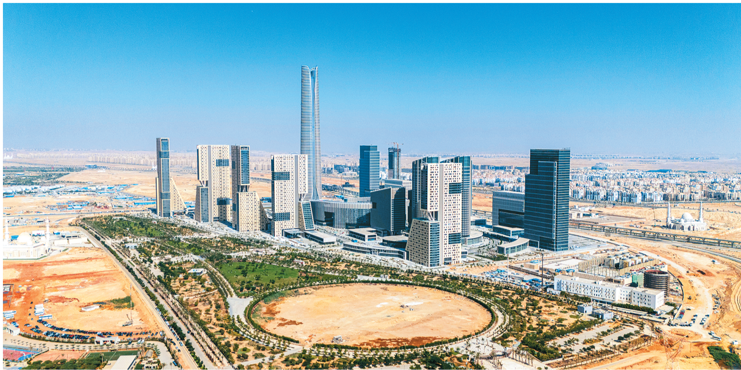
由中国企业承建的埃及新行政首都中央商务区项目是中埃共建“一带一路”重点合作项目。图为埃及新行政首都中央商务区。

到欧洲建研发中心，去中东卖奶茶，在非洲修铁路，去南美建大桥……中国对外投资近年来规模持续扩大，结构不断优化。近日，商务部、国家统计局和国家外汇管理局联合发布《2023年度中国对外投资统计公报》（以下简称《公报》）显示，当前，中国对外投资平稳健康发展，呈现出投资领域多元化的趋势，境外企业覆盖全球超过80%的国家和地区，涵盖了国民经济的18个行业门类。