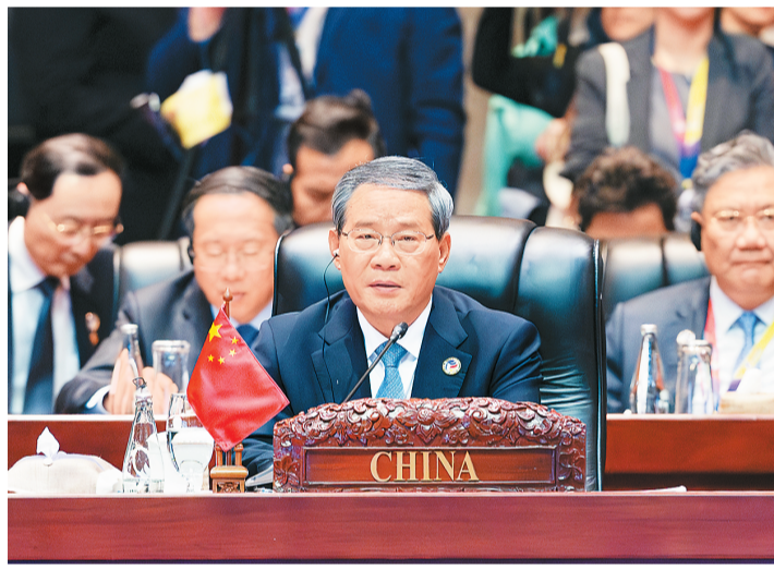
当地时间10月11日，国务院总理李强在老挝万象出席第19届东亚峰会。

本报万象10月11日电（记者陈尚文、杨一）当地时间10月11日，国务院总理李强在老挝万象出席第19届东亚峰会。