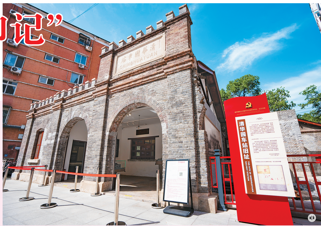
图①：京张铁路清华园车站。