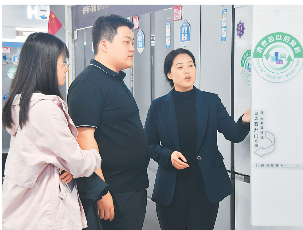
河北省邯郸市永年区抢抓假日商机，持续开展家电以旧换新促销活动，提振消费信心，激发家电市场消费新活力。图为10月7日，当地消费者正在选购冰箱。

家具家电及家居类商品消费快速增长。国庆假期，各地通过打折让利、线上团券等方式惠及消费者，促进家用电器和音像器材同比增长149.1%，其中冰箱等日用品、电视机等家用视听设备同比分别增长160.8%和100.2%。家具、装饰材料、涂料等与家居装修相关的商品销售也呈快速增长态势，同比分别增长35.7%、12.9%和26.2%。