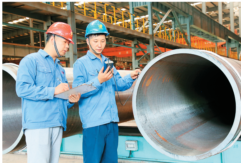
近年来，江苏省扬州市涌现出多家在各自领域内具有领先地位的高科技企业。截至今年8月底，扬州市有243家高新技术企业，营业总收入2000多亿元。图为日前，在直径1498mm热轧超大口径低温柔度无缝钢管生产企业——江苏扬州龙川能源装备有限公司，质检员在检查出口海外的钢管。

一是针对经济运行中的下行压力，强化宏观政策逆周期调节，各方面都要持续用力、更加给力。二是针对国内有效需求不足等问题，把扩内需增量政策重点更多放在惠民生、促消费上，积极发挥投资有效带动作用。三是针对当前一些企业生产经营困难，加大助企帮扶力度，切实优化营商环境，帮助企业渡过难关。四是