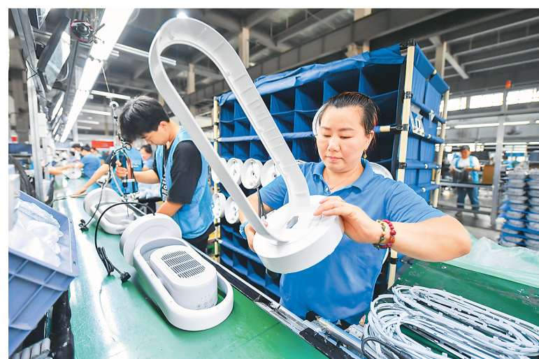
湖南省宁乡市近年来抢抓家电消费升级契机，大力发展智能家电产业，引进智能家电产业链企业60多家，各企业不断增强智能家电产品研发力度，积极拓展市场。图为日前，宁乡市金洲新城的湖南斗禾智能电器有限公司内，工作人员在生产取暖器。

中广核2024年海外开放日活动以“共建清洁美丽世界”为主题。继巴西之后，中广核还将在法国、马来西亚、纳米比亚等多国联动举办海外开放日活动。活动进一步拓展体验深度和形式，将参观体验、科普教育、生态旅游和自然观察有机结合，同时开展线上传播，增进海外公众对清洁能源的了解和认知。