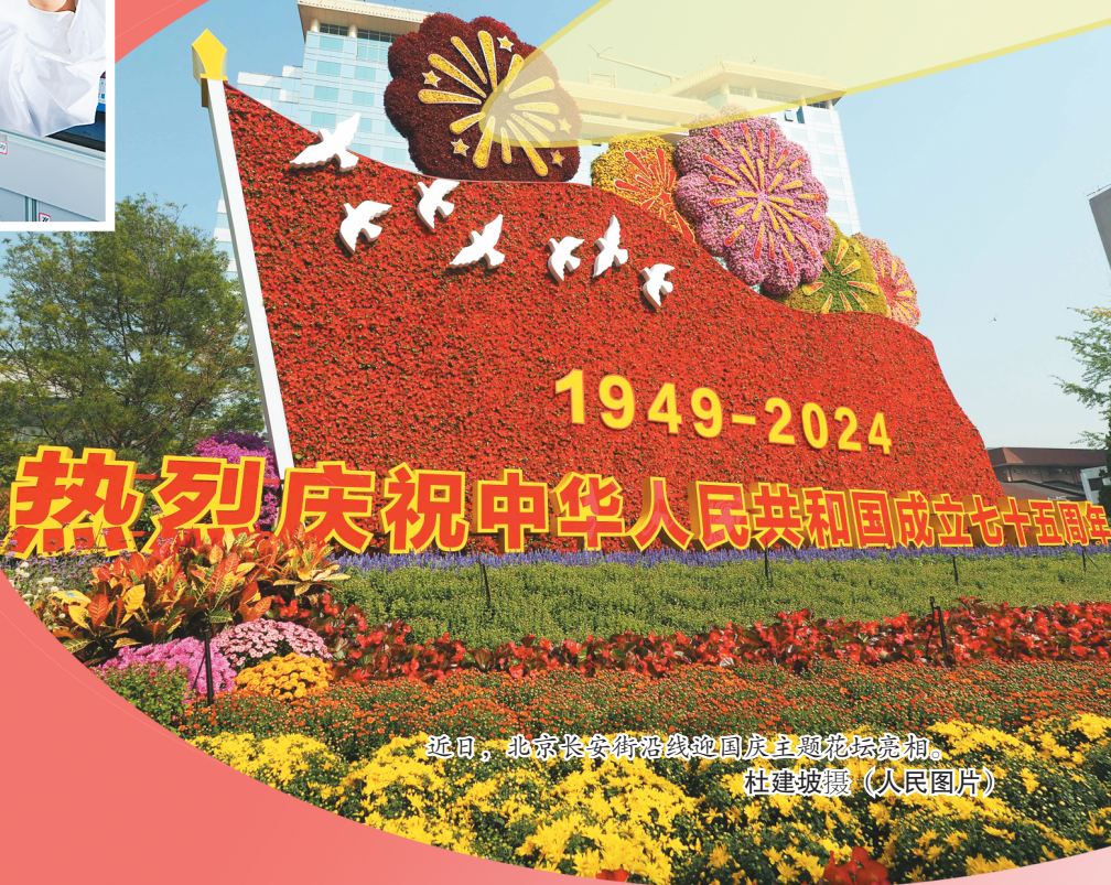
近日，北京长安街沿线国庆主题花坛亮相。