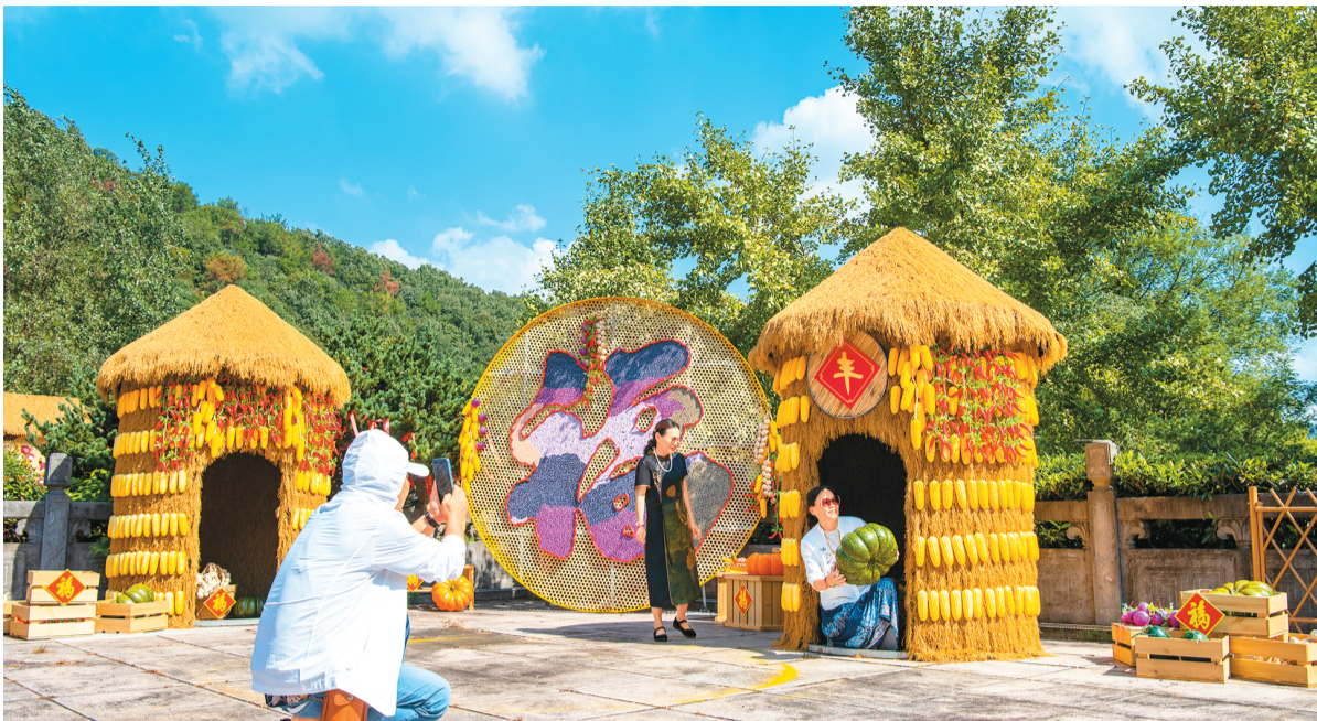
游客在安徽省芜湖市孙村镇八分村马仁奇峰景区里的福文化景点游玩。