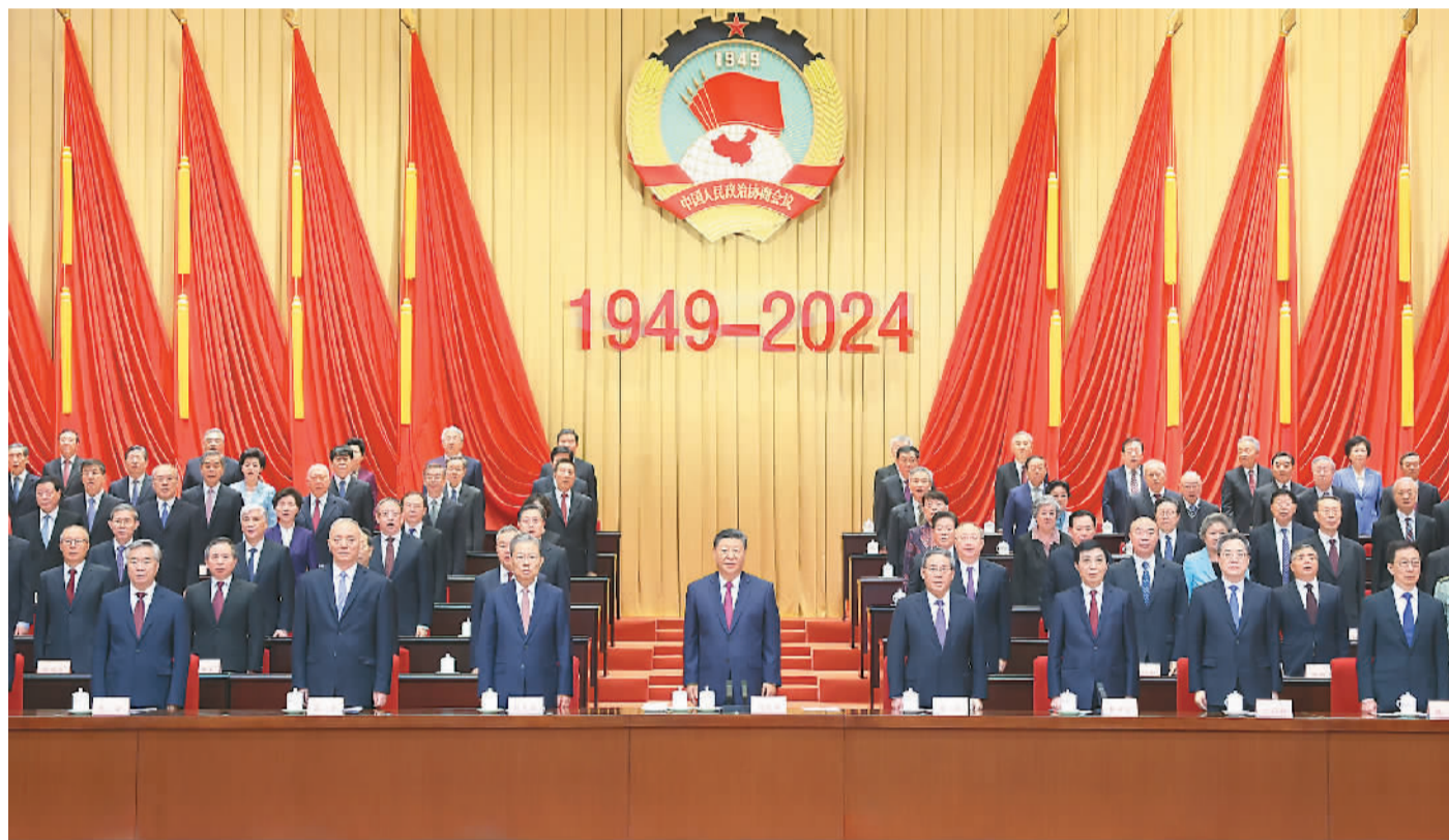
9月20日上午,中共中央、全国政协在全国政协礼堂隆重举行庆祝中国人民政治协商会议成立75周年大会。习近平、李强、赵乐际、王沪宁、蔡奇、丁薛祥、李希、韩正等出席大会。

■我们要更加坚定道路自信、理论自信、制度自信、文化自信,在发展全过程人民民主中把人民政协的显著政治优势更加充分发挥出来,不断巩固和发展生动活泼、安定团结的政治局面