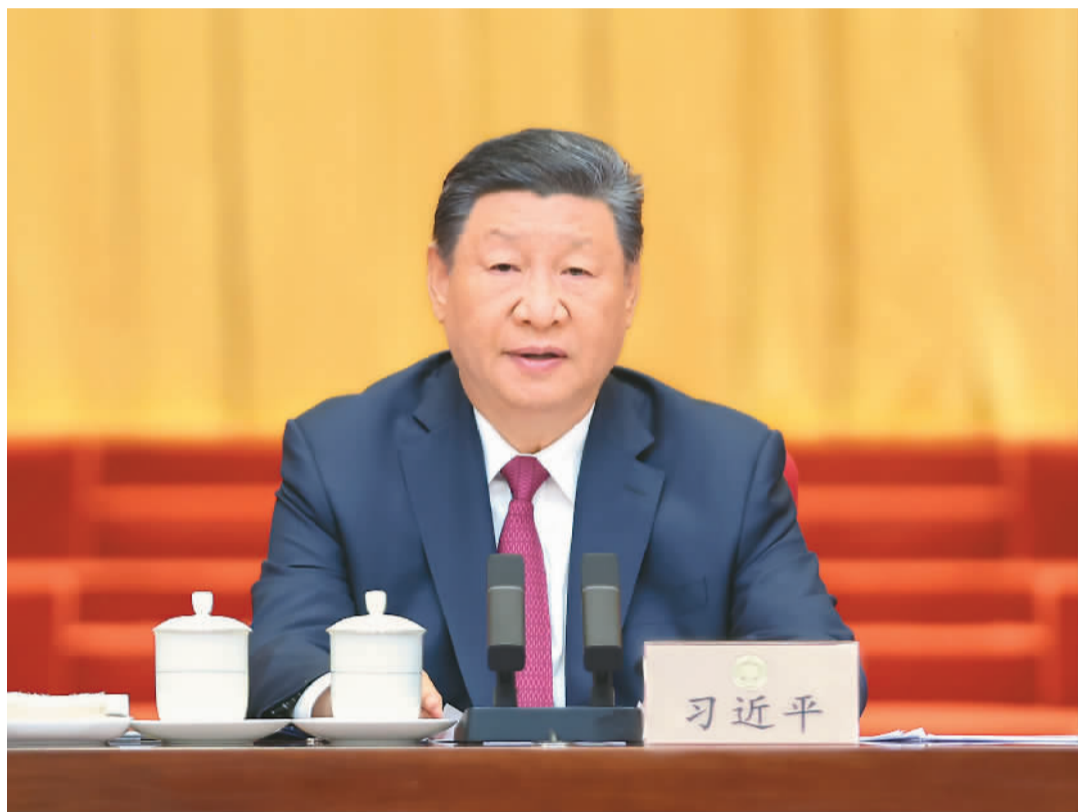
9月20日上午,中共中央、全国政协在全国政协礼堂隆重举行庆祝中国人民政治协商会议成立75周年大会。中共中央总书记、国家主席、中央军委主席习近平出席大会并发表重要讲话。