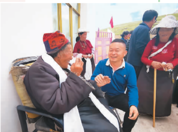
青年作家在会场外交流。