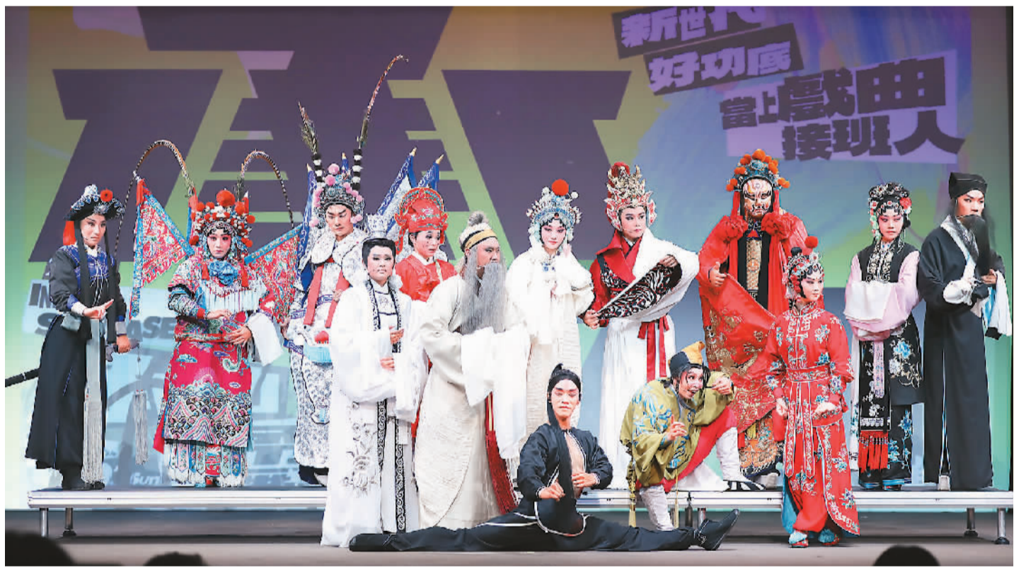
台湾传统艺术中心近日在台北举办“2024 承功——新秀舞台”记者会宣布，10月17日至11月3日，14名戏曲新星将在台湾戏曲中心同台拼戏。图为演员合影。

（上接第二版）沙中在国际地区问题上的立场相近，肩负共同责任。沙中都坚持尊重别国主权、奉行不干涉内政原则。沙方高度评价中方在巴勒斯坦问题上秉持公正立场，愿同中方密切国际多边事务协作，为维护地区及全球的和平、安全与稳定作出贡献。