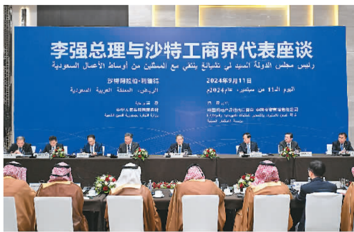
当地时间9月11日上午，国务院总理李强在利雅得同沙特工商界代表座谈交流。新华社记者 饶爱民摄

本报利雅得9月11日电（记者王迪）当地时间9月11日上午，国务院总理李强在利雅得同沙特工商界代表座谈交流。沙特投资大臣法利赫、商务大臣卡斯比以及沙特公共投资基金、沙特国家石油公司、沙特基础工业公司、沙特国际电力和水务公司、阿吉兰兄弟控股集团等企业负责人和中国—海合会共同投资联合会代表出席。