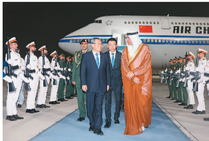
应阿联酋副总统兼总理穆罕默德邀请，国务院总理李强9月11日晚乘包机抵达阿布扎比扎耶德国际机场，开始对阿联酋进行正式访问。阿联酋总统中国事务特使哈勒敦和中国驻阿联酋大使张益明等到机场迎接。

本报阿布扎比9月11日电（记者王迪、张志文）应阿联酋副总统兼总理穆罕默德邀请，国务院总理李强9月11日晚乘包机抵达阿布扎比扎耶德国际机场，开始