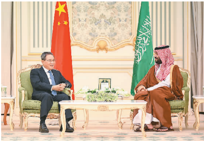
当地时间9月11日下午，国务院总理李强在利雅得王宫同沙特王储兼首相穆罕默德举行会谈并共同主持召开中国—沙特高级别联合委员会第四次会议。

本报利雅得9月11日电（记者王迪）当地时间9月11日下午，国务院总理李强在利雅得王宫同沙特王储兼首相穆罕默德举行会谈并共同主持召开中国—沙特高级别联合委员会第四次会议。