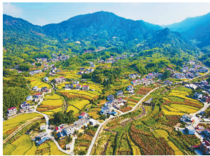
金秋时节, 在安徽省安庆市岳西县尖尖山乡, 各类农作物陆续成熟。梯田与民居、道路、青山等交织在一起, 构成一幅美丽画卷。

朝鲜社会主义事业的征程中不断夺取新的更大胜利。习近平强调, 中朝两国山水相连, 传统友谊历久弥坚。今年是中朝建交75周年暨“中朝友好年”。新时期新形势下, 中方将继续从战略高度和长远角度看待中朝关系, 愿同朝方深化战略沟通, 加强协调合作, 共同维护好、巩固好、发展好中朝传统友好合作关系, 共同推进社会主义事业, 为两国人民带来更多福祉, 为促进地区和世界的和平稳定与发展繁荣作出更大贡献。