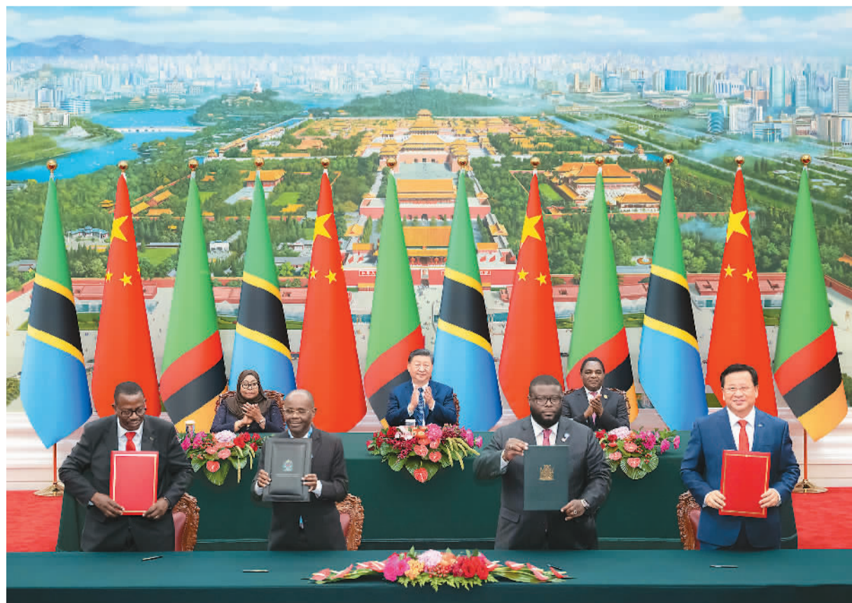
9月4日上午, 国家主席习近平在北京人民大会堂同来华出席中非合作论坛北京峰会的坦桑尼亚总统哈桑、赞比亚总统希奇莱马共同见证签署《坦赞铁路激活项目谅解备忘录》。

李强分别会见尼日利亚总统、佛得角总理 王沪宁分别会见坦桑尼亚总统、布基纳法索总理 丁薛祥会见联合国秘书长 韩正会见俄罗斯总统