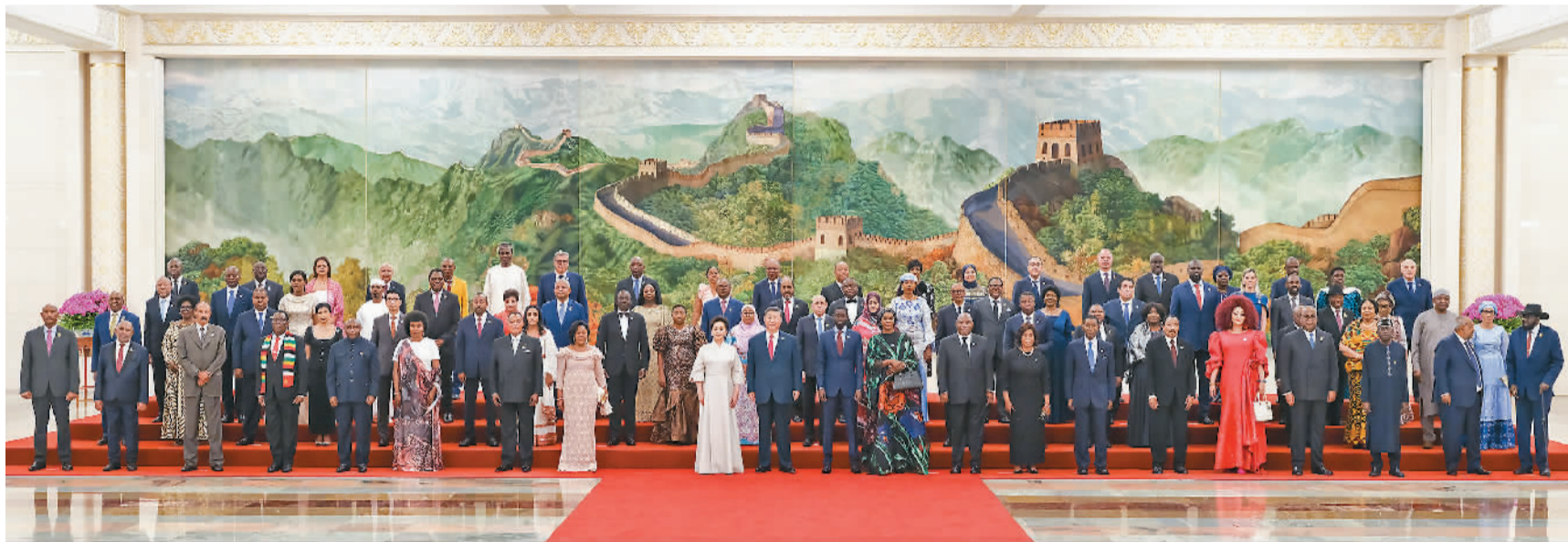
9月4日晚, 国家主席习近平和夫人彭丽媛在北京人民大会堂举行宴会, 欢迎来华出席中非合作论坛北京峰会的非方及国际贵宾。这是宴会前, 习近平和彭丽媛同贵宾们集体合影留念。