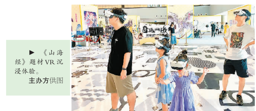
《山海经》题材VR沉浸体验。