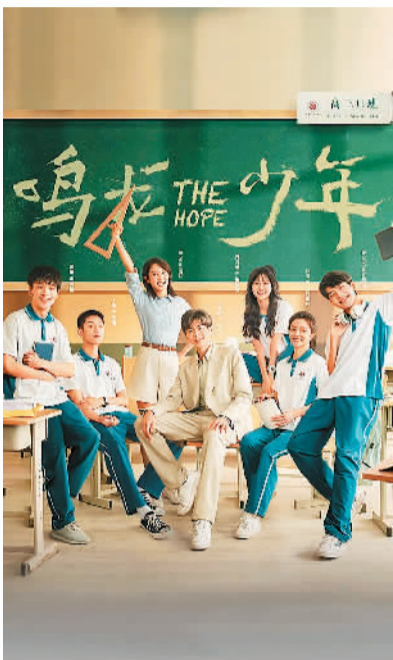
电视剧《鸣龙少年》海报。