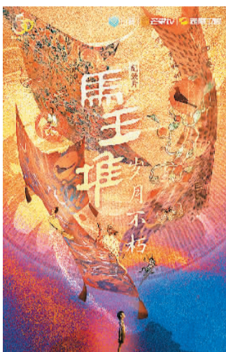
《马王堆·岁月不朽》海报。

第六集《黄老》让人眼前一亮，这是古人超越物质生活的精神世界，隔着千年的时光，祖先的养生、相马、经脉、巫医、占卜、星相、黄老哲学、对天地自然的思考等跃然席上。《马王堆·岁月不朽》带着嘈杂的参观人流，一步步走进古代中国人精致而滚烫的生活，进