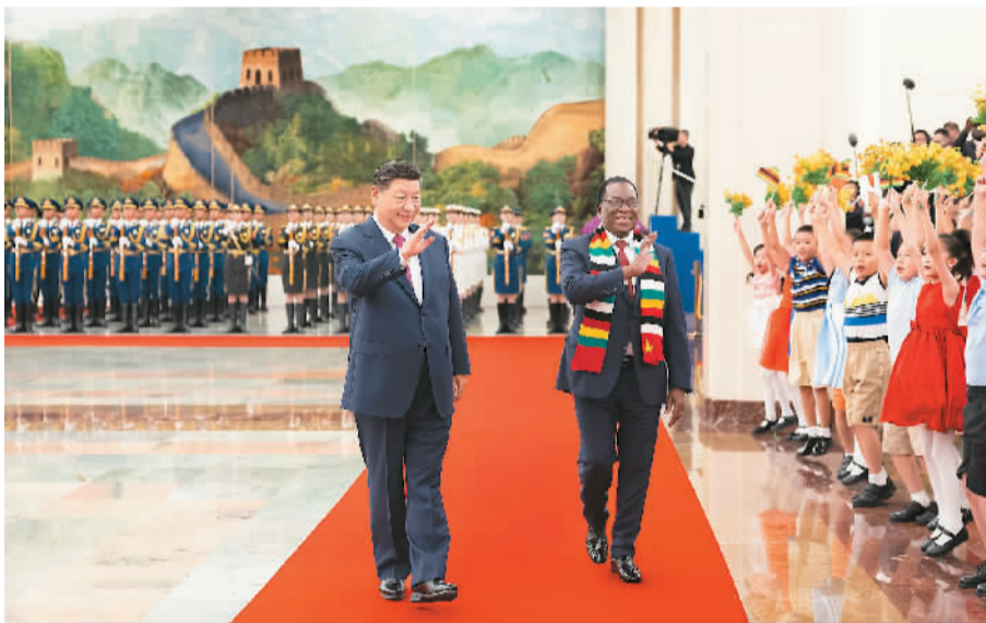
9月3日下午, 国家主席习近平在北京人民大会堂同来华出席中非合作论坛北京峰会并举行国事访问的津巴布韦总统姆南加古瓦举行会谈。这是会谈前, 习近平在人民大会堂北大厅为姆南加古瓦举行欢迎仪式。