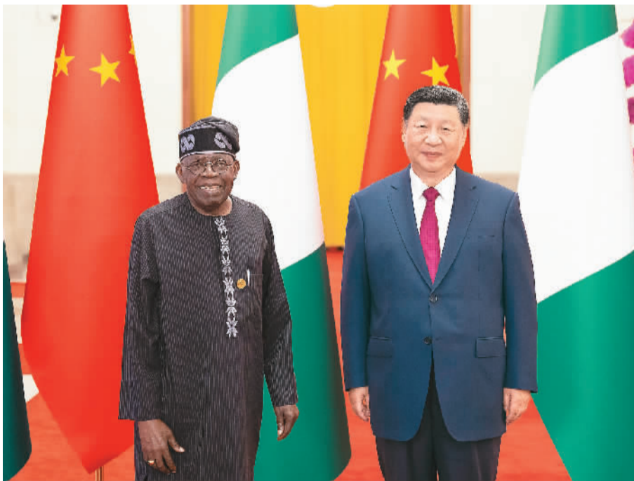
9月3日下午, 国家主席习近平在北京人民大会堂同来华出席中非合作论坛北京峰会并举行国事访问的尼日利亚总统提努布举行会谈。