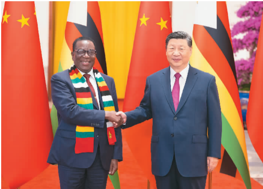
9月3日下午, 国家主席习近平在北京人民大会堂同来华出席中非合作论坛北京峰会并举行国事访问的津巴布韦总统姆南加古瓦举行会谈。