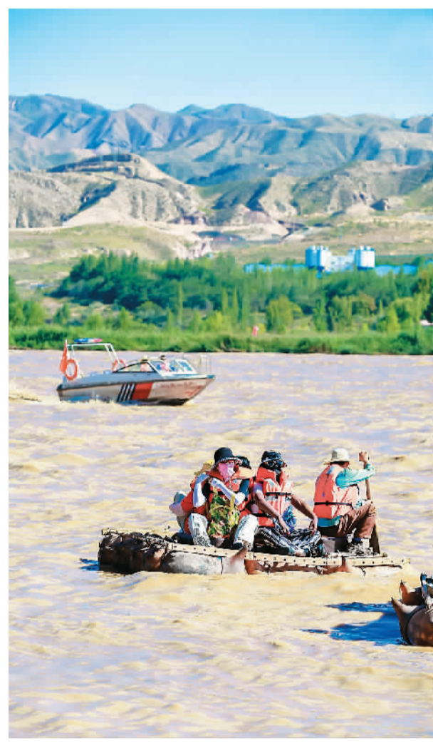
▲ 游客在黄河沙坡头景区段体验羊皮筏子漂流。