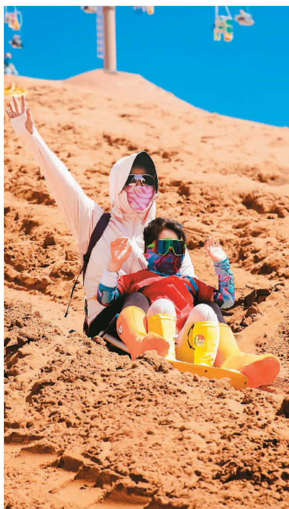
▲ 游客在景区进行激情滑沙项目。