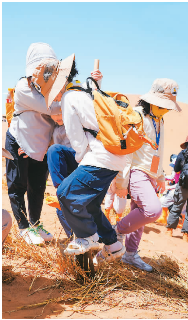
▼ 游客在沙漠体验治沙过程，拿起铁锹将麦草方格扎入其中，牢牢锁住沙丘。