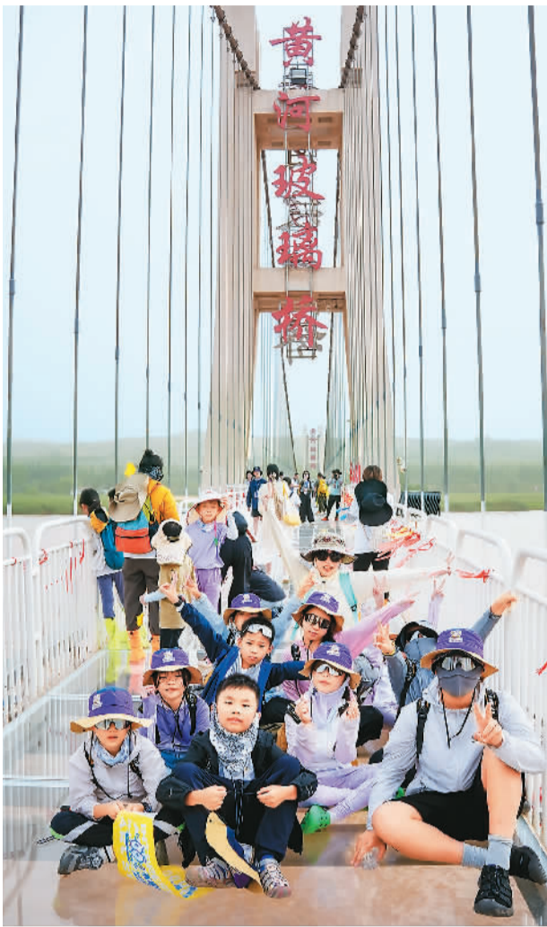
▼ 游客在沙坡头旅游景区的黄河玻璃桥上合影。