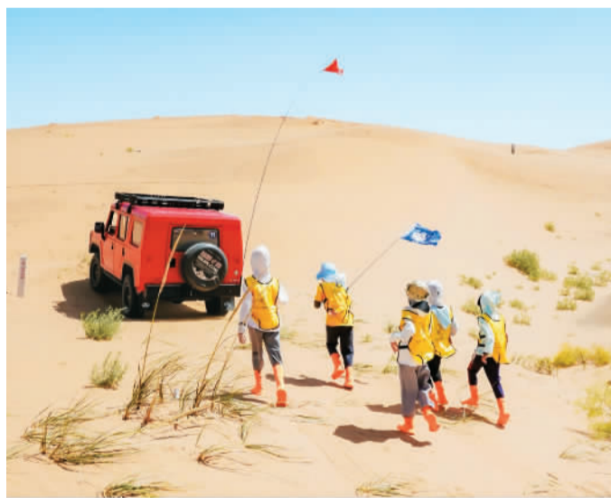
▲ 小朋友们暑假来沙坡头开展研学活动，穿越广袤无垠的沙漠，体验了一场难忘的沙漠徒步之旅。