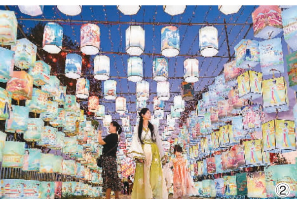
图①:游客在江苏省扬州市东关街游玩。 图②:游客在内蒙古自治区呼和浩特市青城乐水·潮玩谷内的彩灯大世界赏灯。 图③:人们在河北省石家庄市正定县小商品夜市品尝美食。