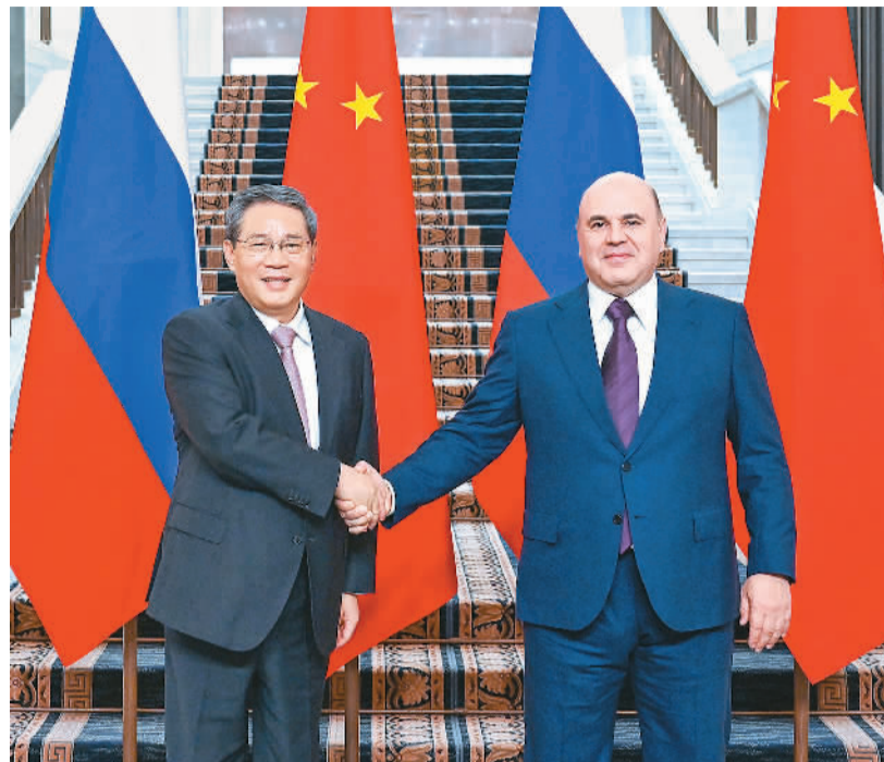
当地时间8月21日上午，国务院总理李强在莫斯科同俄罗斯总理米舒斯京共同主持中俄总理第二十九次定期会晤。

本报莫斯科8月21日电（记者陈尚文、隋鑫）当地时间8月21日上午，国务院总理李强在莫斯科同俄罗斯总理米舒斯京共同主持中俄总理第二十九次定期会晤。李强表示，近年来，在习近平主席和普京总统的战略引领下，中俄关系在高水平上实现高质量发展，两国各领域合作持续展现强大韧性，稳步向前推进。中方愿同俄方一道，遵照两国元首战略指引，以两国建交75周年为契机，坚持相互尊重、彼此信任、世代友好、互利共