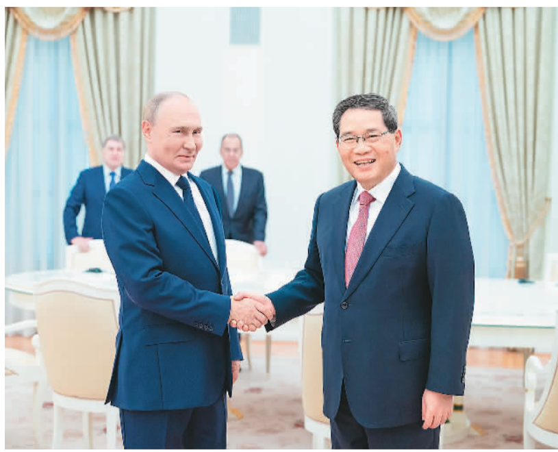
当地时间8月21日下午，国务院总理李强在莫斯科克里姆林宫会见俄罗斯总统普京。新华社记者 刘 彬摄

本报莫斯科8月21日电（记者陈尚文、肖新新）当地时间8月21日下午，国务院总理李强在莫斯科克里姆林宫会见俄罗斯总统普京。李强首先转达习近平主席对普京总统的亲切问候和良好祝愿。李强表示，今年以来，两国元首两度会晤，在中俄建交75周年的历史节点上，为进一步深化双边关系与合作擘画新的蓝图、注入强劲动力。中俄关系稳定发展，不仅