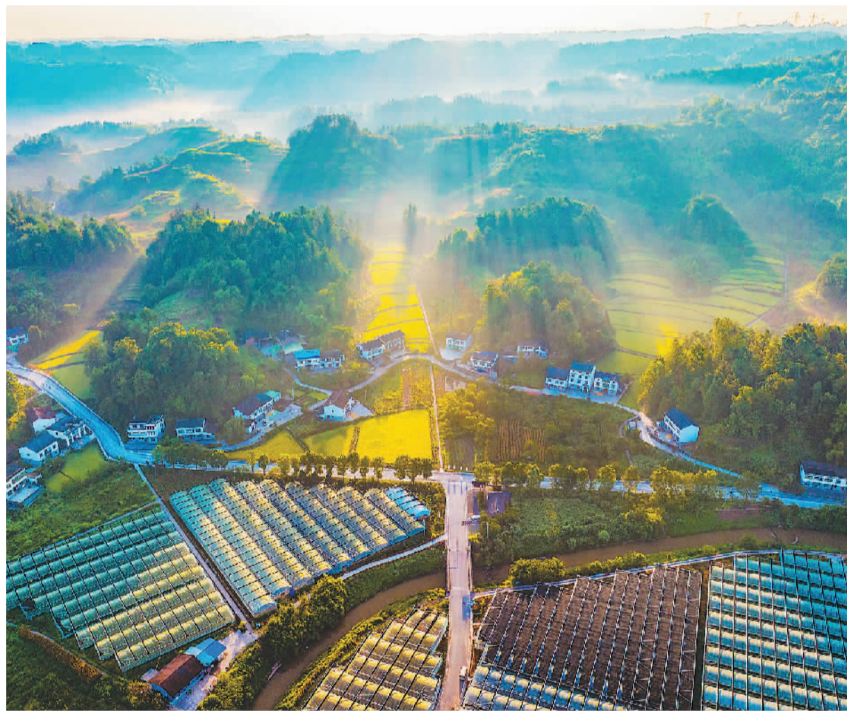
重庆市南川区大观镇以低山和丘陵地形为主，森林覆盖率高，生态环境好。当地依托自然资源优势，发展以蓝莓产业为龙头的特色农业和采摘、垂钓、赏花等体验式乡村旅游，助力乡村全面振兴。图为大观镇铁桥村美景。