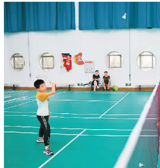
江苏省南京市多所高校体育馆近期对外开放。图为市民在南京特殊教育师范学院羽毛球馆进行训练。

业内人士认为，这次羽毛球涨价也是加速相关制造企业转型升级的机会，应加紧研发新材料，抓住市场机遇。