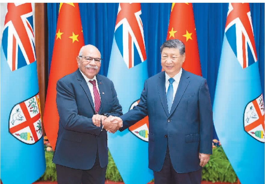
8月20日下午,国家主席习近平在北京人民大会堂会见来华正式访问的斐济总理兰布卡。