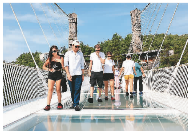
外国游客在湖南张家界大峡谷景区玻璃桥上参观游览。