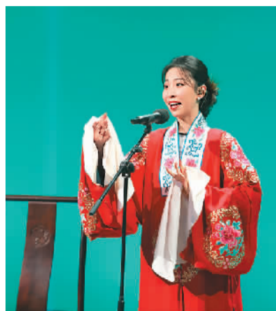
国风音乐人在节目中表演。

正如中南大学教授杨雨在节目中所言：“新一代的国风音乐人正在不断刷新我们的固化思维，用想象力打开国风音乐的更多可能。”通过“戏曲+”的跨界融合模式，《国风超有戏》为年轻国风音乐人提供了一个舞台，将植根传统文化的国风音乐以全新的视听艺术样态呈现出来，为更多人了解中华传统文化打开一扇窗口。