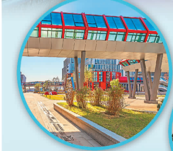
▼哈尔滨创意设计中心。 资料图片