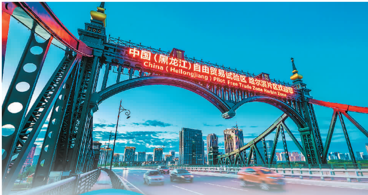
▲中国（黑龙江）自由贸易试验区哈尔滨片区。