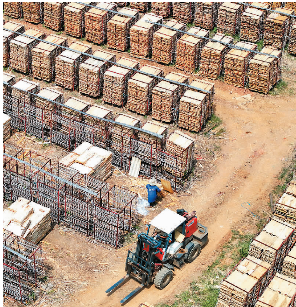
江西省吉安市泰和县积极发展林业产业，将绿水青山转化为金山银山，带动农民增收。图为泰和县塘洲镇板材加工厂内，工人正在晾晒板材。