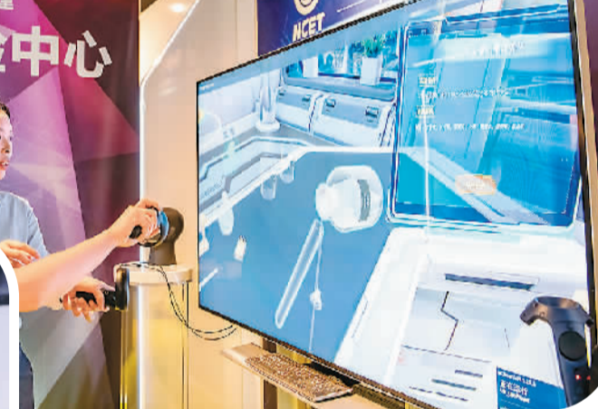
▲福建省福州新区深入推进数字经济创新发展，推动5G、人工智能大模型、大数据、云计算等新一代信息技术深度应用，加快打造东南沿海重要现代产业基地。图为福州新区一家网络公司的VR体验中心内，参观者(左)在体验中小学虚拟实验室。