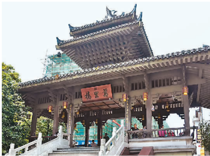
桂林市兴安县北街里是县城内保存较好的清末至近现代建筑群街区。

提升历史文化保护能力水平，需要进一步加强专业人才培养。广西住房和城乡建设厅注重抓好建筑工匠培训，通过成立广西首家行业工匠学院“广西建筑工匠学院”，举办“师傅带徒弟”式的传统建筑工