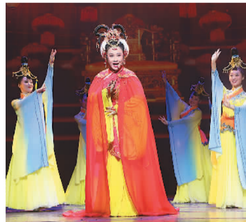
优秀曲艺节目展演现场。

7月25日晚，吉林梨树二人转专场演出举办。演出展现了二人转的发展脉络，节目既有久演不衰的二人转作品《夫妻串门》以及《西厢听琴》《水漫蓝桥》《回杯记》等经典片段联唱，也有历史题材的单出头《昭君出塞》，展示二人转艺术特色的《九腔十八调》，还有致敬全国道德模范张桂梅的《云岭红梅》等作品。整场演出既有传统经典，也有新创精品，包括历史题材、现实题材，展示了近年来吉林梨树曲艺的发展水平和整体风采。