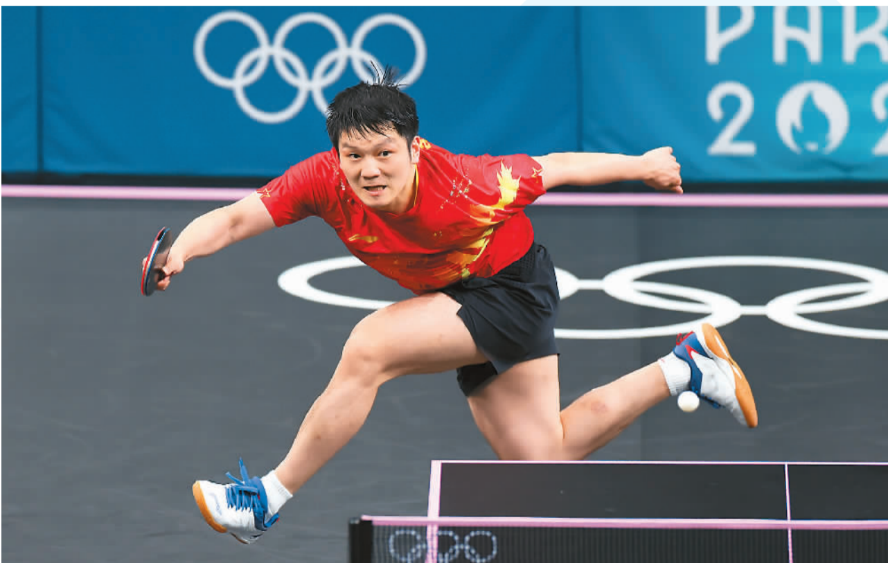
当地时间8月4日，中国选手樊振东在巴黎奥运会乒乓球男单决赛中。

本选手张本智和，樊振东在大比分0:2、2:3落后的情况下稳扎稳打，上演了令人屏息的大逆转，将这位劲敌拦在了4强之外。