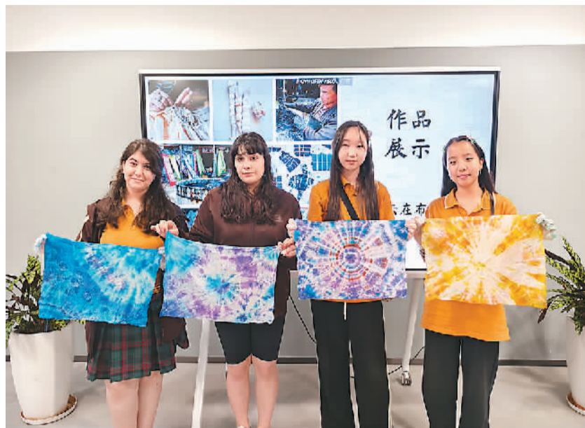
上图：夏令营营员在展示扎染作品。 左图：夏令营营员在才艺展示晚会上表演节目。