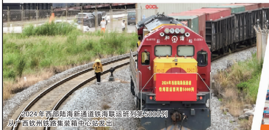
2024年西部陆海新通道铁海联运班列第5000列从广西钦州铁路集装箱中心站发出