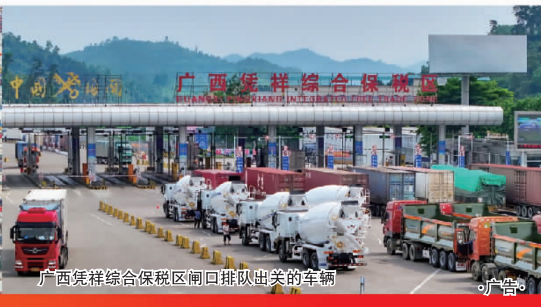
广西凭祥综合保税区闸口排队出关的车辆