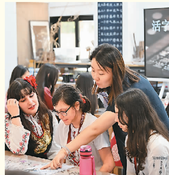
营员们通过课程学习、中国传统文化体验等活动，提升中文水平、了解中国文化。图为外国学生在了解中国文化。

夏令营转眼到了尾声。带着收获与友谊，营员们踏上了归途。这段旅程虽结束，但中文学习之旅才刚刚开始，而心与心的连接，将跨越千山万水，温暖着他们的记忆。